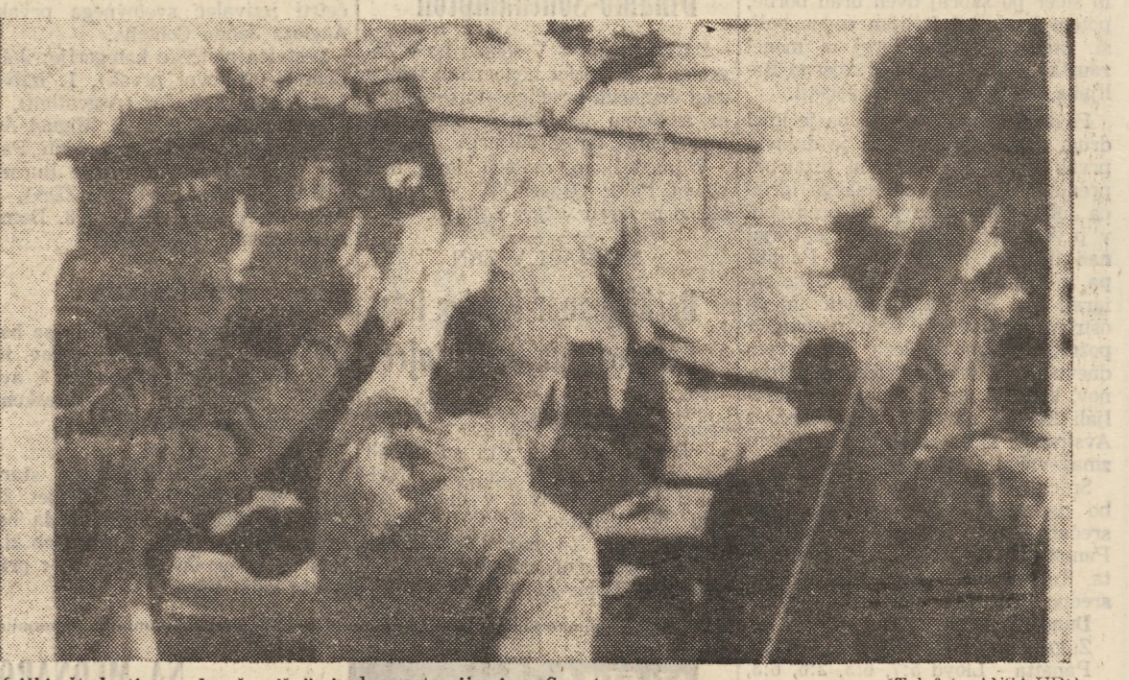
Afriški študentje med večerajšnjimi demonstracijami v Sowetu.

Med večerajšnjimi spopadi z demonstranti v Sowetu policija ubila še enega študenta - Kissinger in Callaghan o vprašanju Južne Afrike in Rodezije