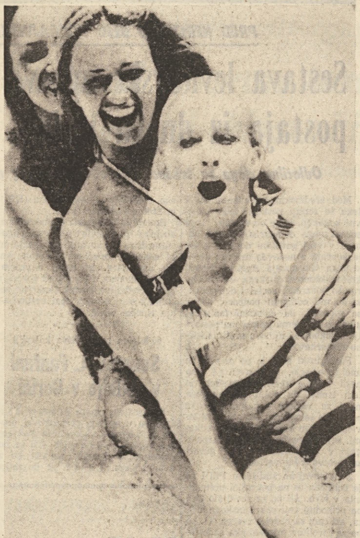
Tudi na Jezeru «Buena vista» v ZDA sonce se pripeka in dekleta se veselo držijo po tobožanu

Minister je še pojasnil, da je treba pripisati te poplave hudemu deževju v zadnjih dneh.