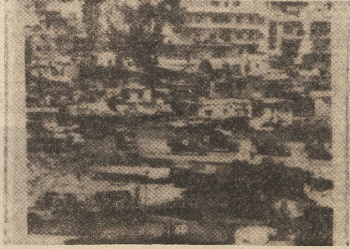
Tovarnjaki Mednarodnega rdečega križa v palestinskem taborišču Tal El Zaatar.

Iz Velike Britanije prihaja medtem vest, da so začelo zaprti kemiko tovarno Coaltite and Chemical Products, v kateri so proizvajali nevtrali dioksin. Gre za tovarno, ki leži v bližini Sheffielda in v kateri je pred 11 leti prišlo do eksplozije, v kateri je umrl kemik, 79 oseb pa je bilo zastrupljenih.