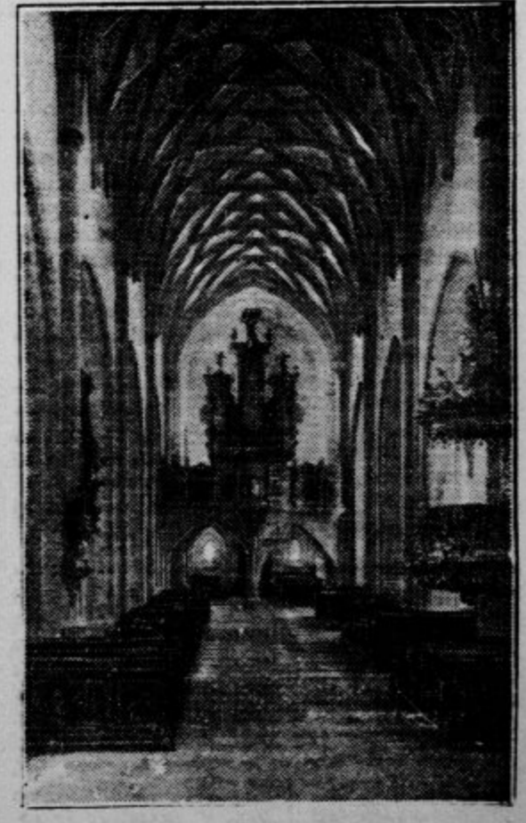
Pogled po gosposvetski cerkvi izpred oltarja proti kani

Tisočev poje gosposvetski zvon. Ob velikih romanjih hite k njemu neke Korošci, od Solnograda in od drugod se zbirajo častilci. Hodimo k njemu tudi mi! Bodimo z njim! Poj tudi nam nocoj gosposvetski zvon! —dr.—