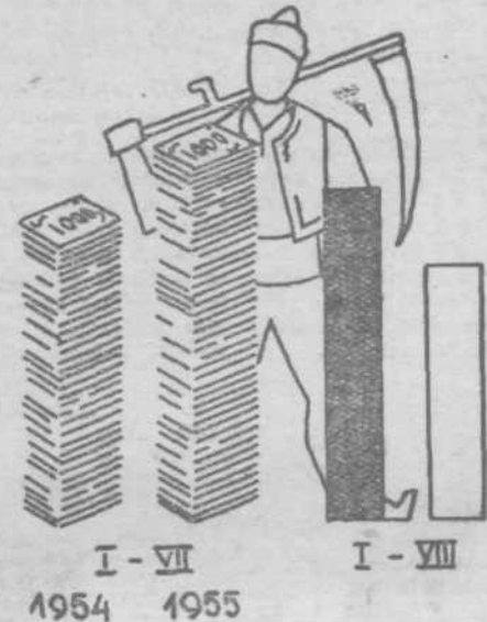
Med tem ko dohodki kmetovalcev rastejo (črtkasta stolpca), vplačevanje davkov v kmetijstvu pada (črni in beli stolpca)

Zaostajanje vplačila davkov se negativno odraža na tržišču v prvi vrsti zato, ker negativno vpliva na ponudbo kmečkih pridelkov. Razen tega vršijo povečani dohodki kmetov večji pritisk na tržišče industrijskih proizvodov, če se del teh dohodkov ne od-