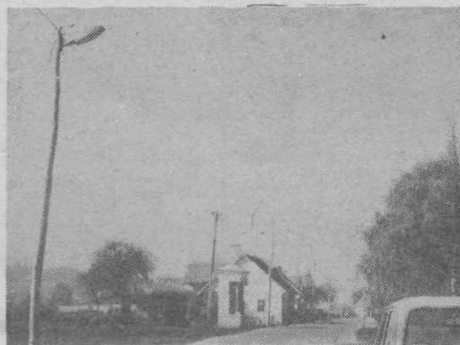
Nova cestna razsvetljava ob Cesti II. grupe odredov

Po večletnem negiranjju in prošnjah so se stvari le premaknile z mrtve točke in delavci so se pričeli postavljati cestno razsvetljava na celotni dolžini ceste od Podlipoglavla do Dobrunj, Litijsko cesto skozi Zadvor, ki je glede tega najbolj kritičen, bo še letos osvetljena, toda le provizorično na križišču pri Glastovcu, ker pripravila TOZD Javna razsvetljava po naročilu občinske Komunalne skupnosti moderno