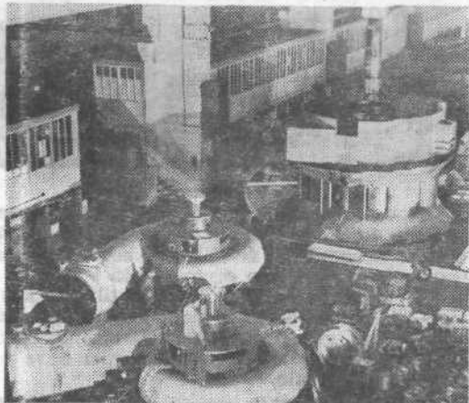
Ob imenu Litostroj seveda najprej pomislimo na turbine...