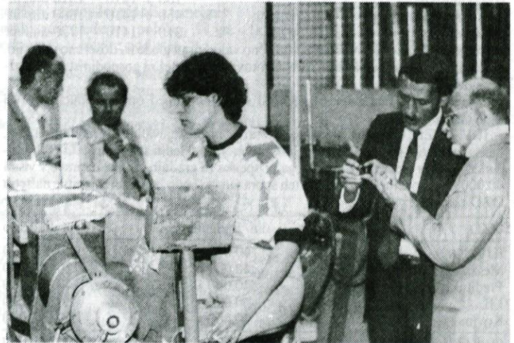
Po podpisu pogodbe so si ogledali proizvodne prostore Kovine in se pogovorili z zaposlenimi, ki še uspešno premagujejo vse ukrepe sedanje ekonomske politike.