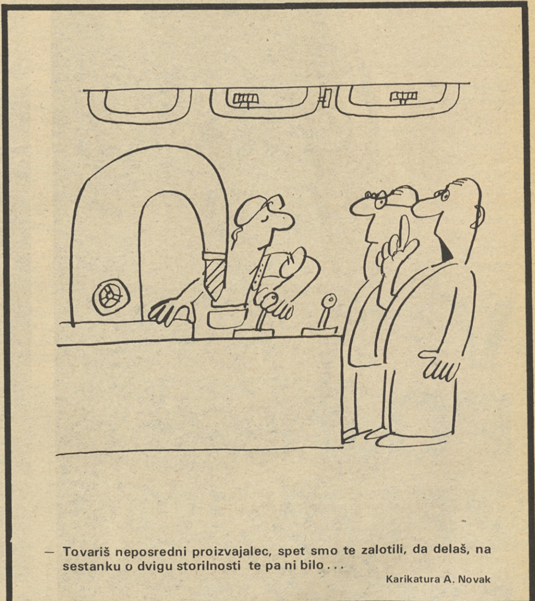
— Tovariš neposredni proizvajalec, spet smo te zalotili, da delaš, na sestanku o dvigu storilnosti te pa ni bilo... Karikatura A. Novak

Delavstvo takrat na Slovenskem še ni imelo svojega lista, da bi se lahko razvila časopisna polemika. Prvi poskusi delavskega časnikarstva so po prvih številkah zaradi oblasti ali finančnih težav žalostno končali. Zato pa je delavstvo na 1. maja 1890. leta z zgledom pokazalo, kaj si o vsem tem misli, pa tudi, da je dovolj zrelo, da svoj praznik proslavi dostojanstveno, mirno, brez neredov. Ideja in praznovanje 1. maja so bile odslej redne manifestacije slovenskega delavstva.