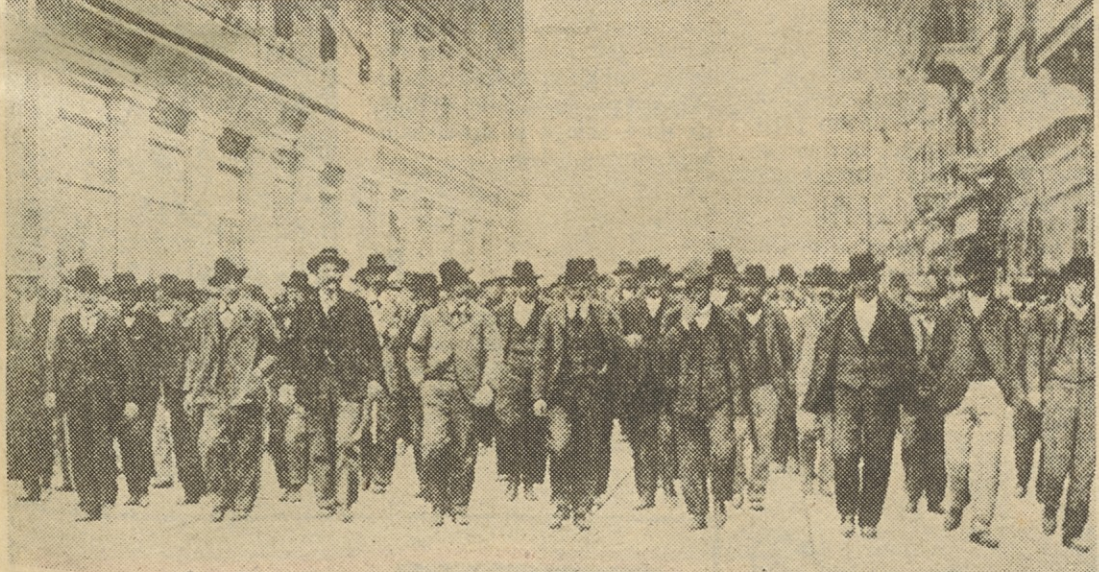
Prvomajski sprevod na tržaškem Corsu

Navedli bomo značilno izjavo enega od vodilnih slovenskih časnikov tistega časa, Slovenca, glasila slovenske klerikalne stranke. Takole je pisal Slovenec, 25. aprila 1890. „Mi nikakor ne stojimo na strani fabrikantov, kjer se gre za pravice delavstva, vselej odločno zagovarjamo te pravice in zahteve, toda zajedno pa odsvetujemo delavcem, morda da brezuspešno, vse to, kar bi ne koristilo delavstvu, temveč mu le škodilo... Pisali in delali smo vselej za blaginjo in prospeh delavstva in slednjemu svetovali naj ne praznuje 1. maja kot delavski praznik, kajti tako „praznovanje“ je osnovano od prevratnih življev, ki bi radi povzročevali izgrede in nemire po načinu francoske revolucije. Odsvetujemo torej takozvano praznovanje delavskega praznika predvsem s krščansko-katoliškega stališča, drugič pa s stališča delavskih političnih pravic, tretjič z narodnogospodarskega stališča in četrtič iz prepričanja, da se socialno in delavsko vprašanje tako ne rešuje in tudi rešiti ne da. Slo-