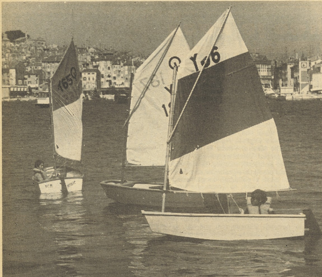
Pomlad je kar na hitro opravila z letošnjo zimo. Zato je toplo vreme mnoge izmed nas že zvalo na morje. Tako tudi pionirje na našem posnetku, ki so se pomerili v jadranju...