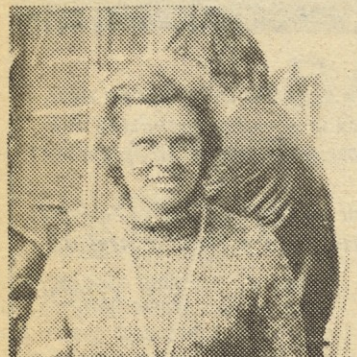
Predstavnica najboljšje ekipe iz mehanične delavnice je prejela pokal...

jev iz te sorazmerno majhne temeljne organizacije Mebla, ki zaposluje 73 delavcev.