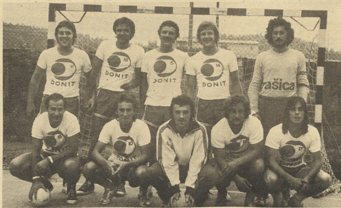
Rokometno moštvo Donita je doslej poželo že več uspehov