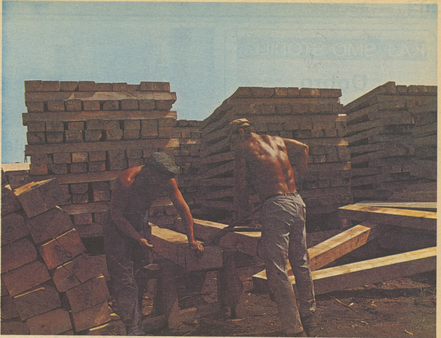
Okovanje železniških pragov . . .