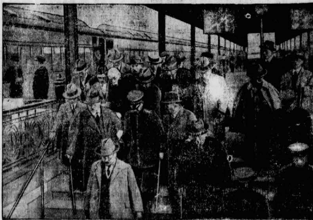
der kürzlich auf dem Bahnhof von Tokio durch den Revolverschuß eines Fanatikers schwer verletzt wurde: der verarmte Ministerpräsident (links oben — barhäuptig) wird vom Bahnsteig getragen.

auf den japanischen Ministerpräsidenten Hamaguchi,