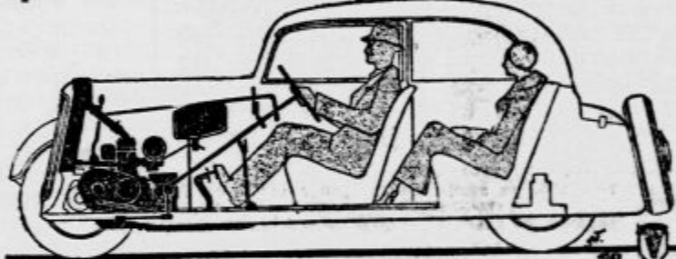
Prerez limuzine »Triglav«-DKW