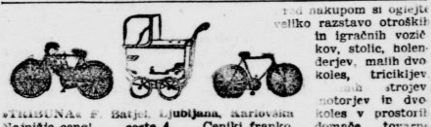
TRINAKA F. Batjcl, Ljubljana, karikovana Najnižje cene! cesta 4 Ceniki franko.

ZITO + Chicago, 21. aprila. Zadržni točaj: Pšenica: za maj 76, za julij 76.875, za september 77.25; koruza: za maj 44.50, za julij 47.125. + Novosadska blagovna borza (21. t. m.) Tendena in cene nespremenjene. Promet je bil slab.