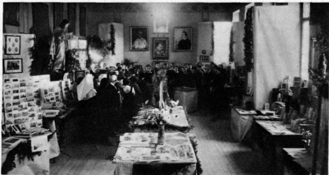
Z razstave Marijinih kongregacij v Sarajevu (Gl. dopis str. 285.)

Zdaj ji povem: »Če je za tvoje zdravje potrebno, da prideš v drugo hišo, kakor jaz lani, saj veš« — (na njenem obrazu se pojavi poteza nepopisne boli) — Pri teh besedah koj poseže vmes: »Da, toda s teboj!« Zagotavljam jo, da bom ves čas pri nji ostala, le ponoči tega najbrž ne bodo dovolili. Ta pripomba jo je nekoliko vznemirila, da je pila kelih bridkosti. Še sem ji govorila in vse je mirno po-