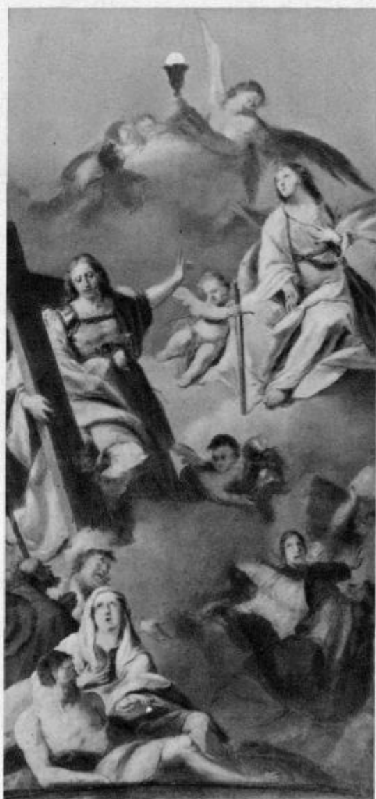
Sv. Ahacij in sv. Barbara