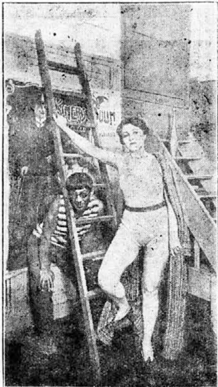
Slavni japonski slikar Fujita s svojo evropsko ženo pri vsakodnevni jutranji telovadbi.

Medtem pa se sumi, da je zaklala starčka otroke iz osvete, ker sta jo gospodar in njegova žena nedavno ostro ukorila.