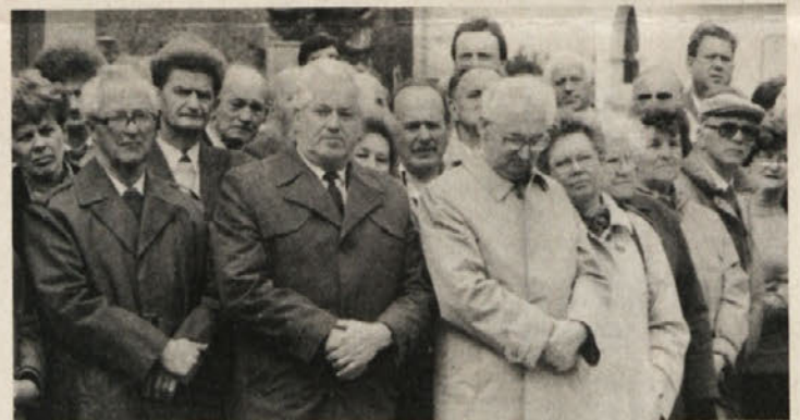
Udeleženci spominske svečanosti v Železni Kapli