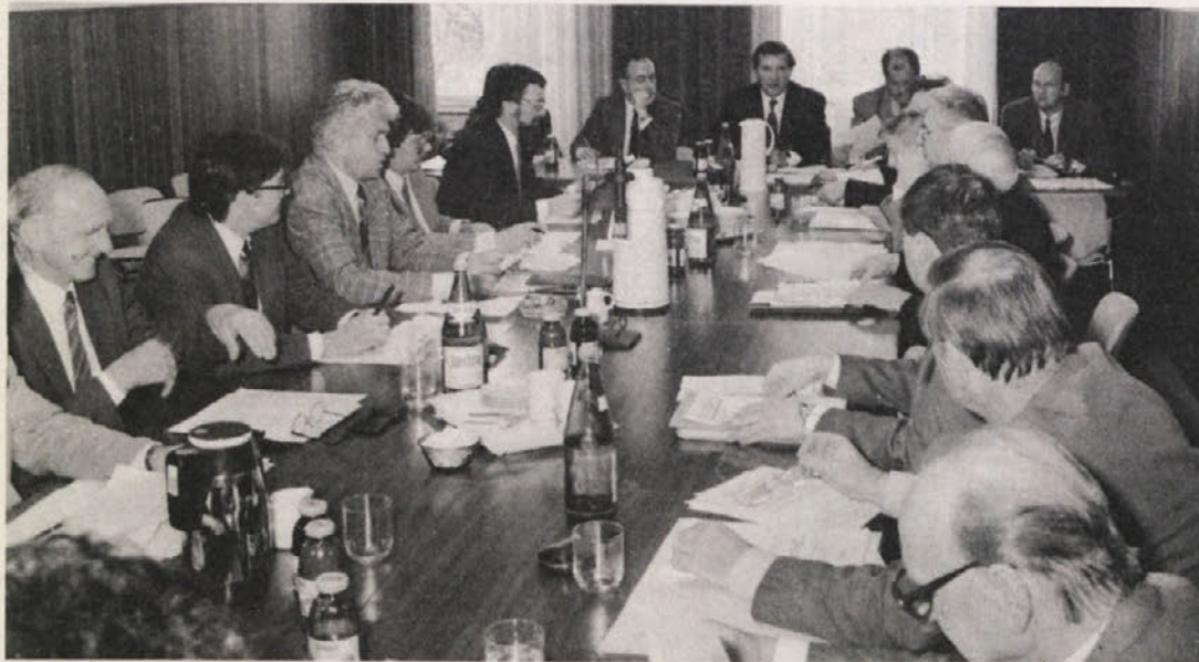
Sosvet za Slovence na seji v Celovcu

Avstrija mu je bila za škorenj prevelika, zdaj se zadovoljuje s Koroško – če mu Korošci to dopustijo.