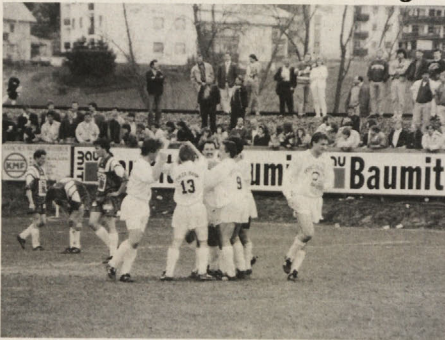
Veselje slovenskih nogometašev po doseženem голу

Ob 17.30 gosti SAK na igrišču v Pliberku slovensko nogometno reprezentanco pod 23, ki se pripravlja na mediteranske igre, ki bodo od 16. do 27. junija. Prijateljska tekma bo za SAK dobra priložnost,