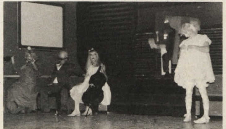
Prizor iz komedije Tartif

Poslovnež Orgon „pada na finte“ Tartifa, ki mu obljublja dobiček s trgovanjem človeških delov telesa. Solze bogataša so vendar ravno toliko