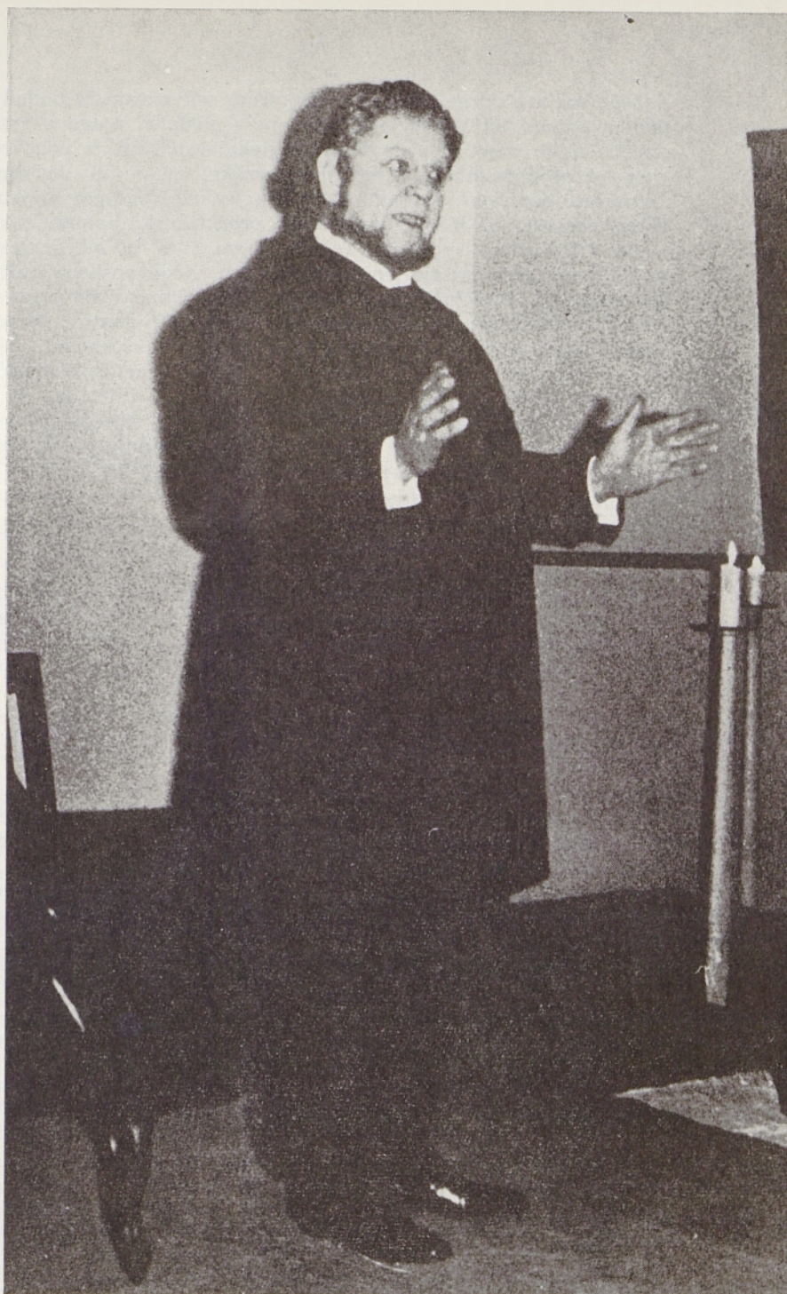
Prizor iz »Krotkega dekleta«