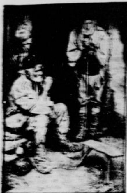
130 letni oče in 105 letna mati. Starena Bolgarka se je vedno jafica pričeta.

Tobak se poznal Indijanci v daljni Ameriki že takrat ko je prišel Kolumb kot prvi belokozec. K njim so prišli Besseni, tobak je pomagal v tistih časih pripo za pušenje. Gorenjci in večji delci Besseni stihano so iztuhli avanci, ki pravijo dema vohana. S tobakovim dimom so se Indijanci že pred stoletji omamili.