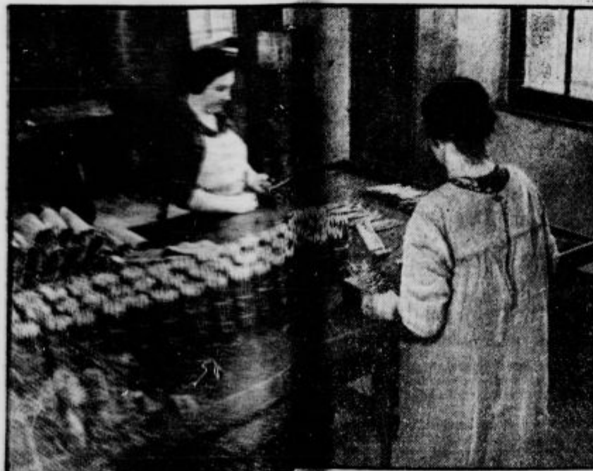
V ekipečih šeno tovarne

Tako pripravljene liste navlažijo. Nato tobak spravijo v shrambe, kjer se zopet kvasi. Zdaj šele pridejo tobakni listi v rezalne stroje različnih mer, zatem pa v cigaretno stroje. Naj omenimo, da napravi v običajnih prilikah en sam stroj nad pol milijona cigaret dnevno.