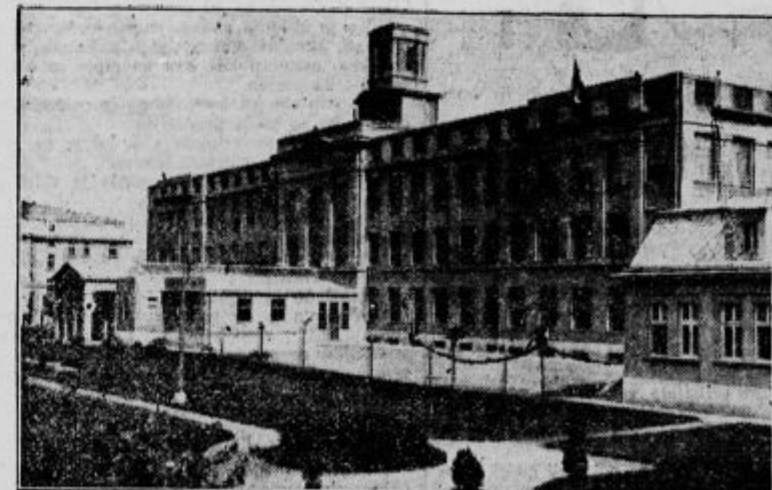
Tobakna tovarna v srbskem Nišu.

navlažijo. Na ta način dobi klobasa pravi okus za naše čikarje. Ko so klobase za čik dovolj navlažene, gredo v prodajo.