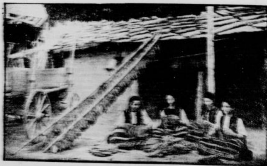
Tobakne liste narečujejo na travici in jih suše ob hišah.

Presaditev vrše po veliki ženski in izru vtraka svojo posebno posel. Prva vrsta v zemljo izlozevi kolček in z njim izvta lokotico. Namjo vtakne sadiko in jo prihrdi s klinom. Druga prilija k sadiki vode tretja jo pravično zavuzi. Na njivo k meti okrog 15 avov gre do 10.000 sadik. Rastline k se se posušijo, zamenjajo z novimi. Med letom jih je treba večkrat okopat. Čim manj je ročec, ko sadike roči, tem