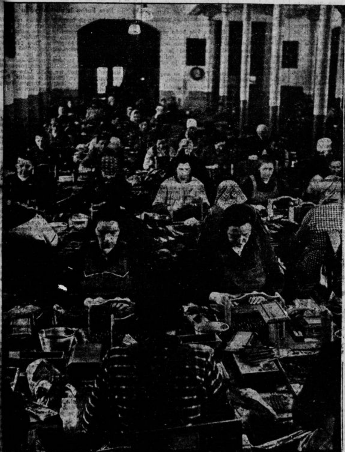
Pogled v eno izmed dvoran tobačne to- varne: Pridne rokē tobačnih delavk iz listov božje travce delajo užitke za to- bakarje: cigare in cigarete.