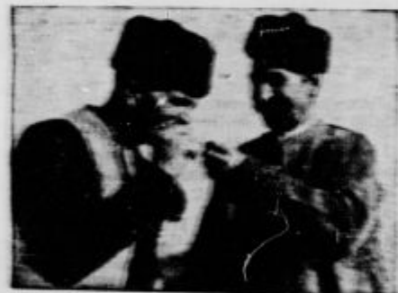
Trije vrste bolgarske kadilca.

Bivši jugoslovanski državni monopol je prodajal tobak v mnogi druge evropske države, predvsem na Poljsko in v Češkoslovaški.