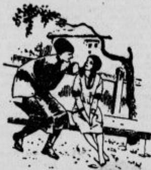
Sedela sta na klopci.

Pogostokrat sta s Tamaro zvečer sedela na klopci pod akacijami in se pogovarjala o burnih dogodkih njene preteklosti.