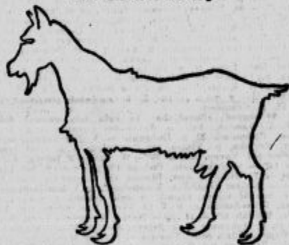
Narišl z eno potezo!