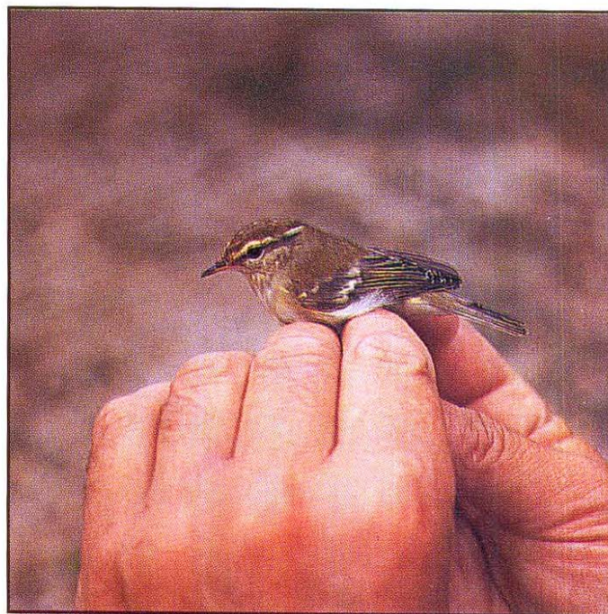
Slika 2: Mušja listnica Phylloscopus inornatus , 10. oktober 1997, Ljubljansko barje (A. Sovinc)

Fig. 1: Yellow-browed Warbler Phylloscopus inornatus , October 13th 1996, Ljubljansko barje