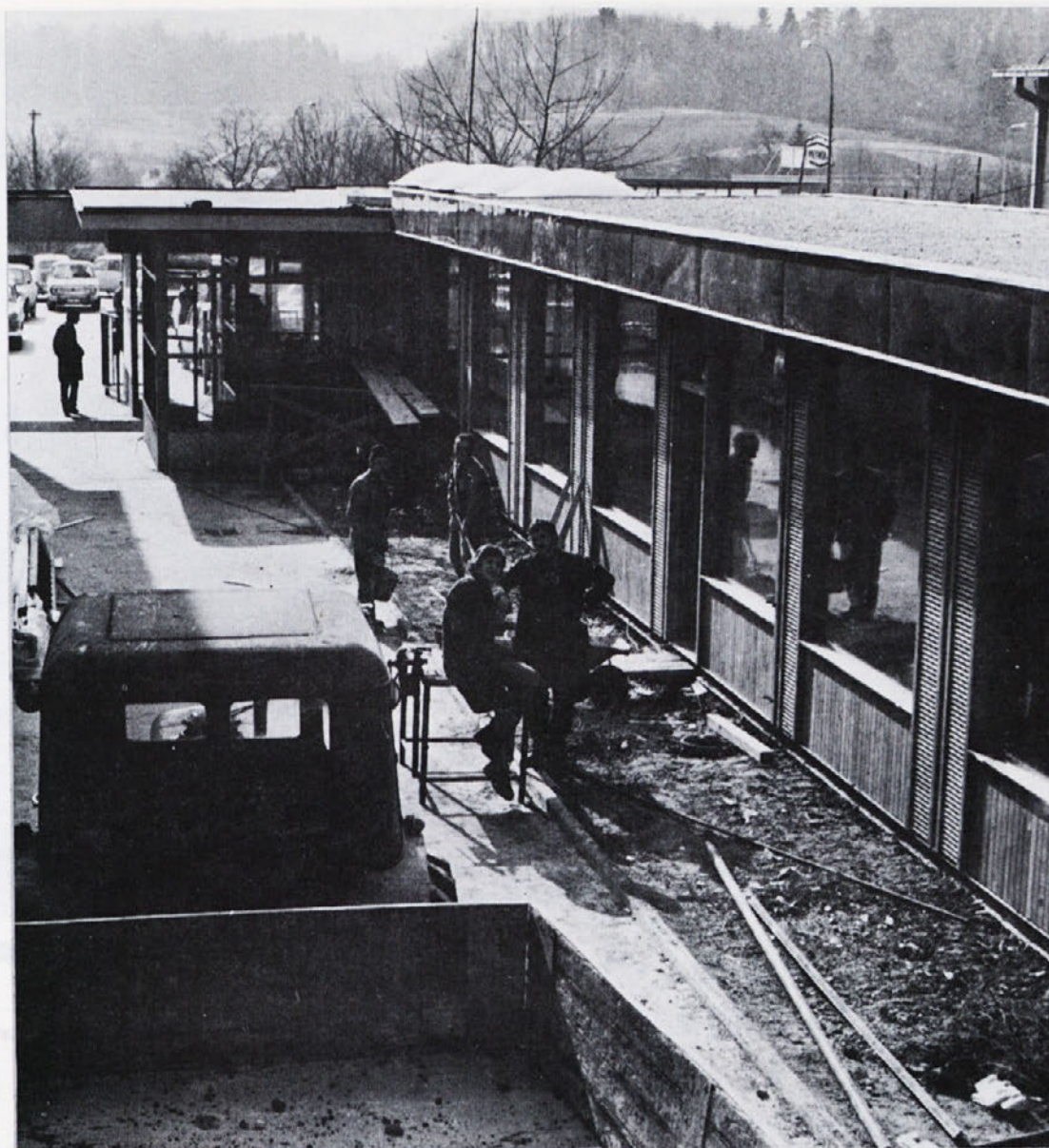
Gradnja je končana! Prepotrebni prostori za komercialo, izvoz, uvoz in splošni sektor so na razpolago