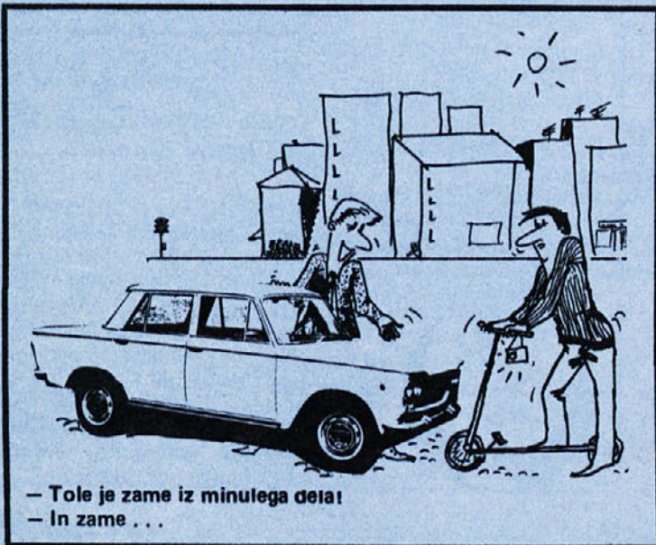
– Tole je zame iz minulega četa! – In zame ...