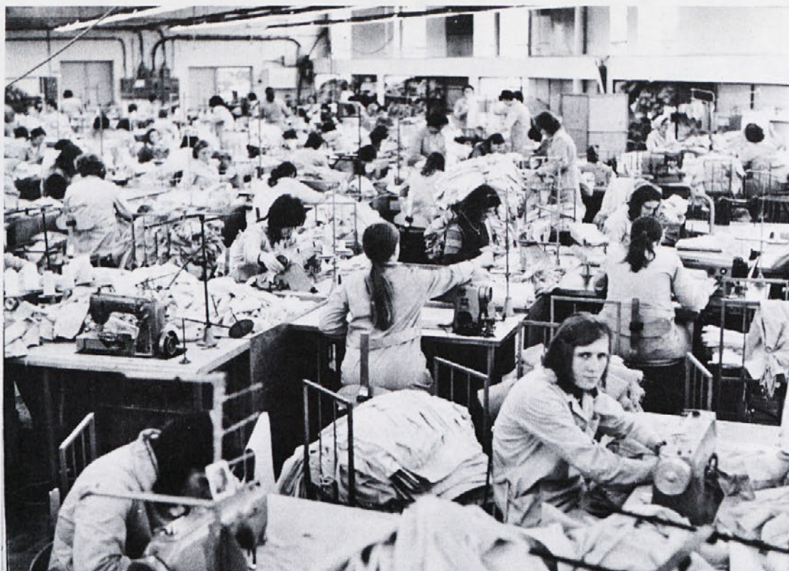
Izvolili smo delegate. Vez med delegacijo in proizvajalci bo v novih razmerah kar najbolj neposredna.

V TOZD LIBNA je od 377 vpisanih volilcev glasovalo 343 ali 90,9 odst. Neveljavnih je bi-