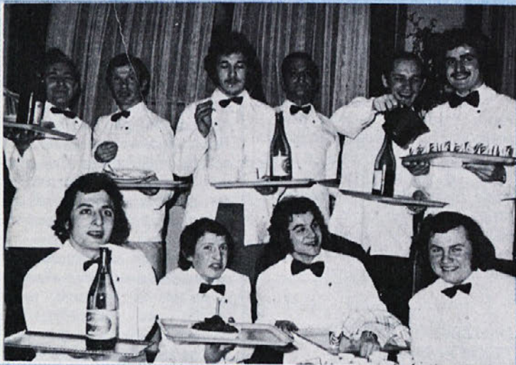
Letos smo imeli v Novem mestu odlično natakarsko ekipo. Kaj ne bi, 8. marec je na srečo le enkrat na leto ...