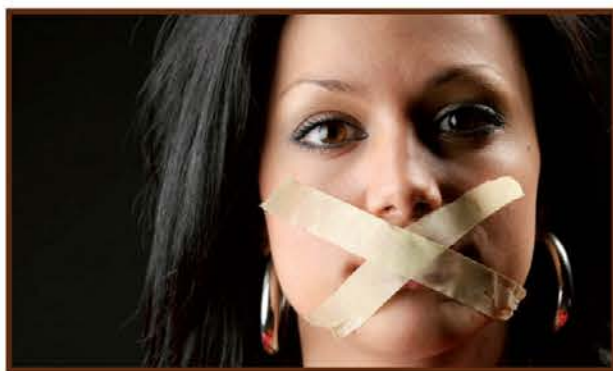
Boj za več svobode pa prinaša strah, da s to svobodo ne bomo vedeli kaj si pomagati.

odjemalci velikega brata. Dogaja se to, da je internet v manj kot dveh desetletjih spremenil generacijo ljudi do take mere, da iz aktivnih državljanov moderne družbe, ki bi morali z visoko izobrazbo nekaj dati skupnemu dobru, postajamo preplašene sence, ki kukajo v svet le še preko profilov socialnih