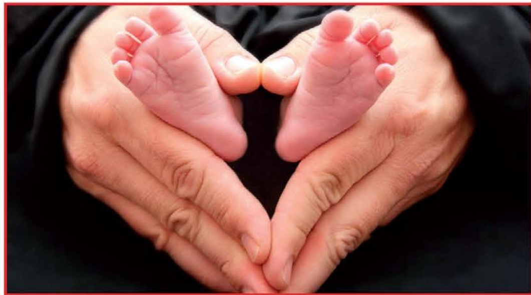
Brez celotnega človeškega razvoja je napredek na tem svetu obsojen na propad.

Kriza je lahko tudi provokacija, ki nam pomaga spremeniti pogled na celotno družbo in njene posamezne dele, kot je npr. gospodarstvo. Smo pripravljeni na ta izziv? Obstajata dve slepi ulici, v katerih se lahko izgubimo. Prva nevarnost je beg od resničnosti, beg v idealizem, ki naše želje izenači z realnostjo. Druga nevarnost pa je odpoved idealom, hrepenjenjem in željam. Vprašanje torej je: kako upoštevati naša hrepenjenja in ideale na eni strani