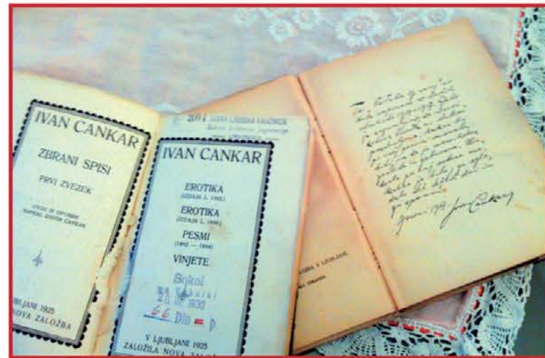
Verjetno največja kulturna dragocenost, ki jo posedujem na knjižni polici - Cankarjevi Erotika (druga izdaja) in namerno neimenovana dediščina prababice, a z njegovim posvetilom.

Veste, da so 'kulturniki' protestno zažgali