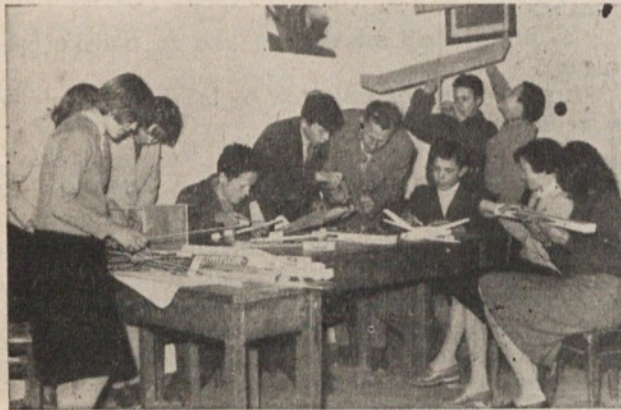
Tehnični krožek na osemletki v Polhovem gradu

Na pevski reviji, ki je bila ena za predel bivše občine Vič in ena za predel bivše občine Rudnik je nastopilo 19 zborov s 1418 pevci. Za sektorsko tekmovanje v Logatcu sta določena zbor iz Hor-