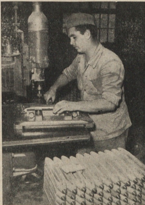
■ Izdelava čolničkov

nih naprav, je predstavljala iztrošenost le teh v 1959. letu 78,9 odstotka. Lani so sami naredili 300 kg težko hidravlično stiskalnico z impregnacijsko napravo, prenosni tir za sušilnico in nabavili vrsto novih naprav, vendar so stroji še vedno 76,4% iztrošeni. Osnovna sredstva so se v letu 1960 povečala za 20 milijonov, medtem ko je 5 milijonov vloženi v nedokončane investicije.