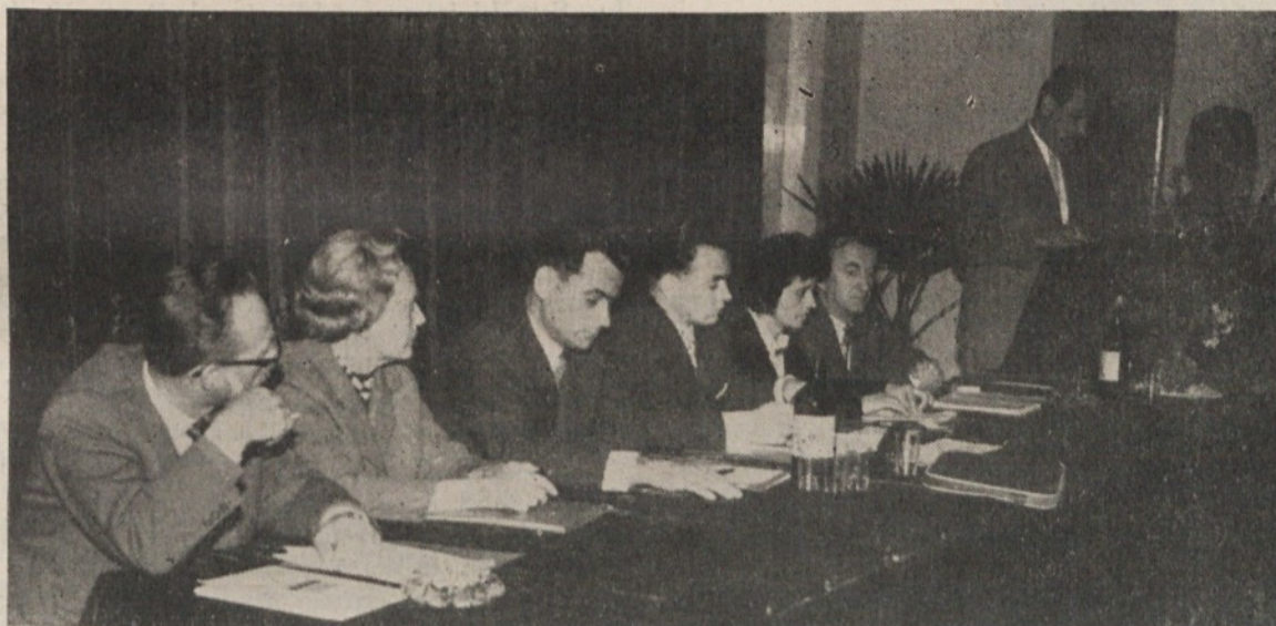
Delovno predsedstvo občinske konference ZK

Res je, da imajo komunisti velike zasluge za družbeno-politično aktivnost v naši komuni; delegati pa so ob analizi družbeno-političnega dela poudarili tudi velike zasluge in prizadevnost številnih družbenih delavcev, ki niso komunisti. Delegati so bili mnenja, da ne bi bilo prav, če bi komunisti prav povsod sami skušali neposredno reševati odgovorne naloge. Dolžni pa so seveda, pomagati družbeno-političnim organizacijam, ki so poklicane za reševanje nalog. Težišče dela v ZK je na vsakem posameznem članu, ki naj odigra pozitivno vlogo v svojem okolju, na sestankih pa naj se posvetuje s svojimi tovariši in z njimi izmenja izkušnje, ki jih dobiva pri vsakdanjem delu. Sicer pa naj člani ZK pomagajo utrjevati samostojnost vseh družbenih organov in organizacij; istočasno pa naj skrbe, da bodo po zaslugi prepričevanja in osebnih zgledov idejno vplivali na delo teh organov. To je tudi v skladu z dejstvom, da so družbene organizacije izgubile nedanjo vlogo transmissije ZK.