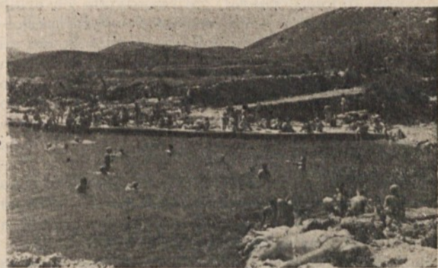
Kopališče v Nerezinah je spet oživeło

V bližini doma se nahajajo zelo lepa naravna kopališča, ki so primerna tudi za otroke. S pomočjo Turističnega društva Nerezine in oblastnih organov računajo na gradnjo večjega novega kopališča.