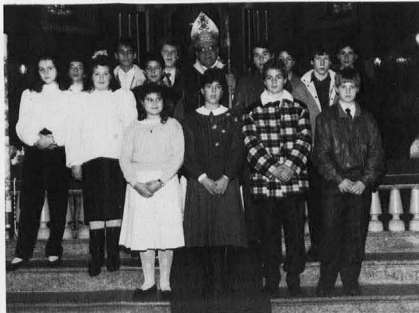
Predzadnji birmanci v Nabrežini, ki se pripravljajo na pastoralni obisk goriškega nadškofa od 28. novembra do 1. decembra