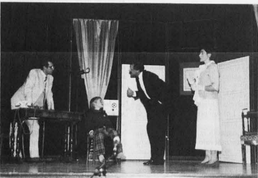
Na sliki prizor iz Nušičeve igre »Dr.«, ki jo je predstavila dramska skupina ODER 90