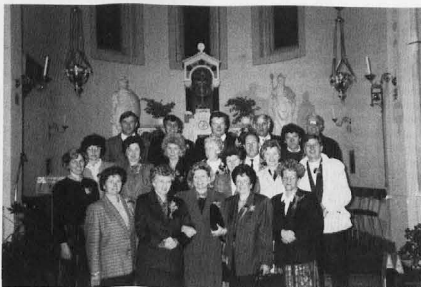
Petdesetletniki iz Števerjana in Jazbin so praznovali. Po sv. maši so šli v Grad na Dobrovo