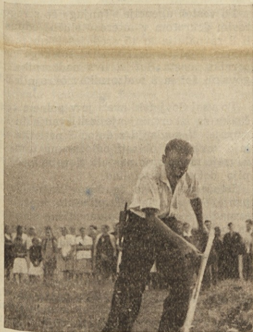
Kosa dobro reže

povezanost z zemljo na kateri živi; ohranja in razvija mu njegove najbistvenejše prvine in oblike: jezik, običaje in navade, narodno pesem in krepak rod.