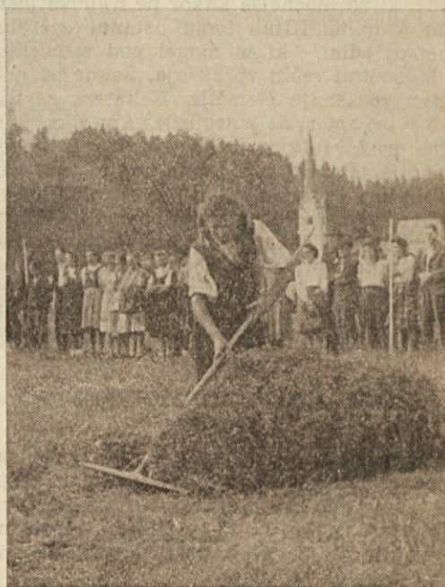
Za kosó pridejo na vrsto grablje

Kadar ti bo najhujše, reci z našim največjim pesnikom Francetom Prešernom: »Manj strašna noč je v črne zemlje krili kot so pod svetlim soncem sužnji dnovi!«