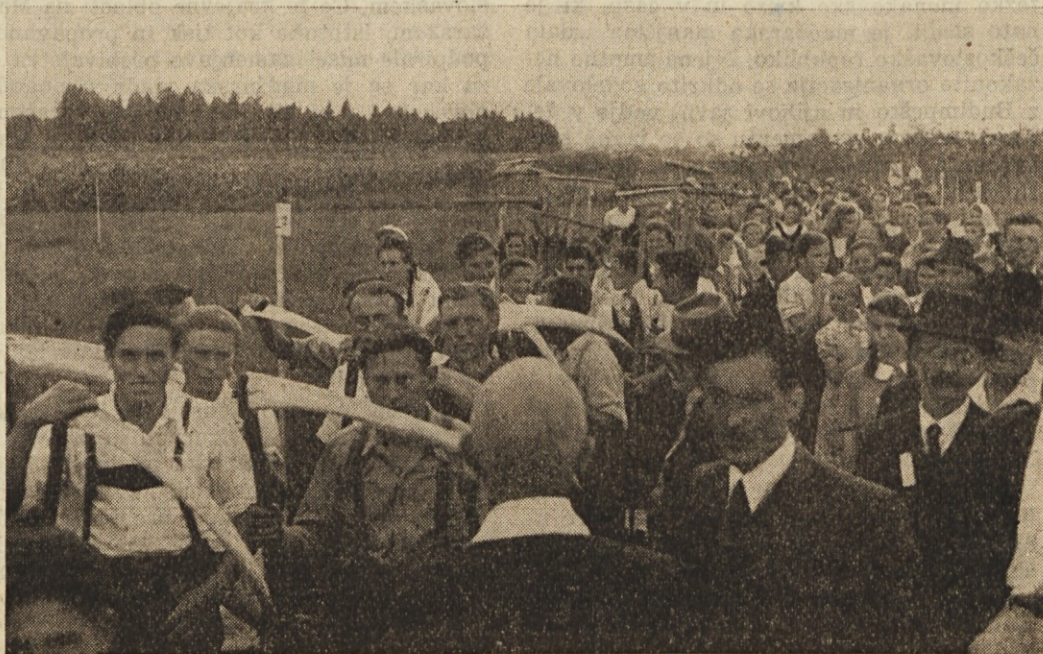
Šmihel: Kosci in gledalci pred pričetkom tekme koscev

Najprej si bomo ogledali v poglavitnih obrisih prvo skupino, t. j. gospodarske vzroke za beg podeželske mladine s kmetov.