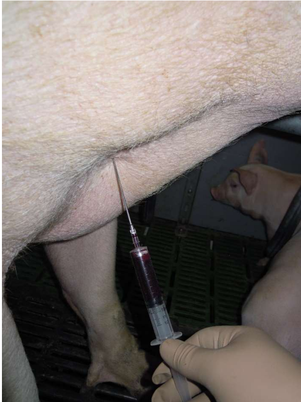
Slika 2: Odvzem krvi iz v. cavae cranialis