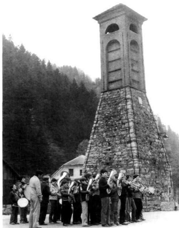
Budnica 1. maja 1983

Zadnja leta orkester redno nastopa na čipkarskem dnevu. V soboto popoldne, pred otvoritvijo razstave čipk, orkester priredi promenadni koncert pred Muzejem. V nedeljo pa sodeluje pri po-