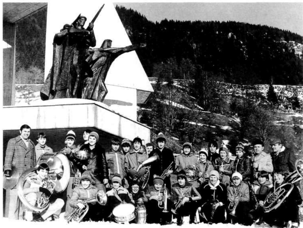
„Po poteh partizanske Jelovice“, 11. januar 1980

Program dela našega orkestra v letu 1981 je dokaj obsežen. Naučiti se moramo dve novi koračnici, dve novi žalostinki ter kompletan program desetih skladb, igrati "paradno", to se pravi igrati in korakati.