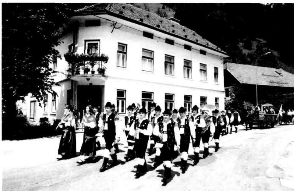
Sprevod ob praznovanju Čipkarskega dne

vorki klekljaric, narodnih noš, konjenikov skozi Železnike in na osrednji prireditvi spodbuja klekljarice k hitrejšemu klekljanju na tekmovanju.