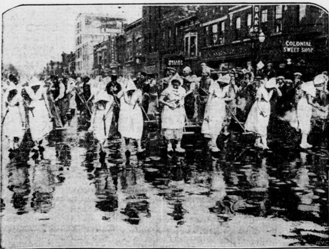
Prebivalci mesta Holanda v državi Michigan (USA) so vsi Holandi ali holandskega porekla. Vsako leto na praznik tulipanov se odpravijo dekleta in fantje v stari narodni noši na glavno ulico in jo pometejo ter opesejo. Tako je bilo tudi letos.