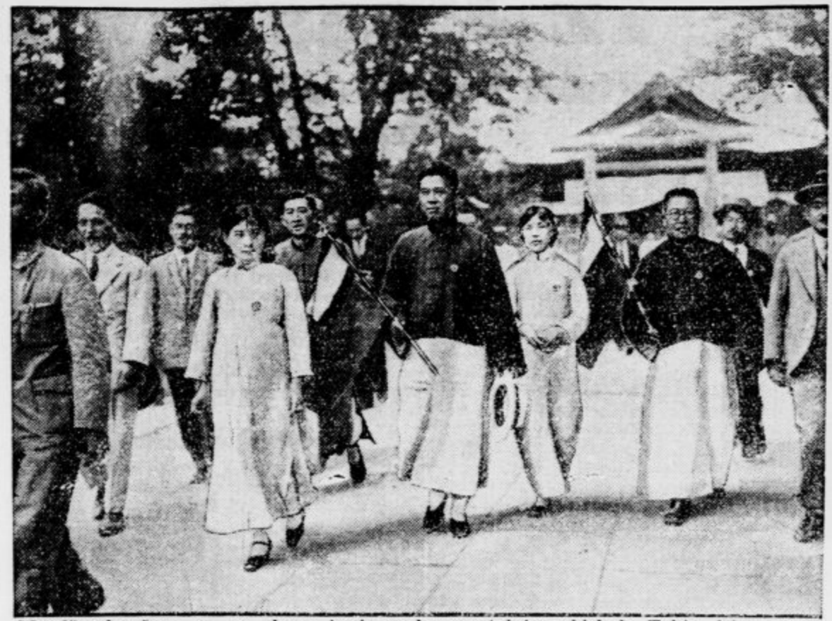
Mandžurske žene so po ukazu iz japonske prestoinice obiskale Tokio, kjer so se poklonile v svetišču žrtvam vojne.