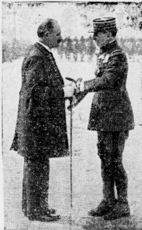
Albert Lebrun pozdravlja na narodni praznik pariškega guvernerja generala Gourauda.

Trdovratno zapeko, katar debelega črevesa, napetosti želodčne motnje, za- stajanje krvi, nedelavnost jeter, zlato ži- lo, bolečine v kolkih odpravimo z upo- rabo naravne »Franz Josefove grenčice, če jo izpujemo zjutraj in zvečer malo ča- šico. Zdravnikove strokovne veličine iz- pričujejo, da učinkuje »Franz Josefova« grenčica celo pri dražljivem črevesu brez boelčin. »Franz Josefova« grenčica se do- bi v vseh lekarnah, drogerijah in spece- rijskih trgovinah.