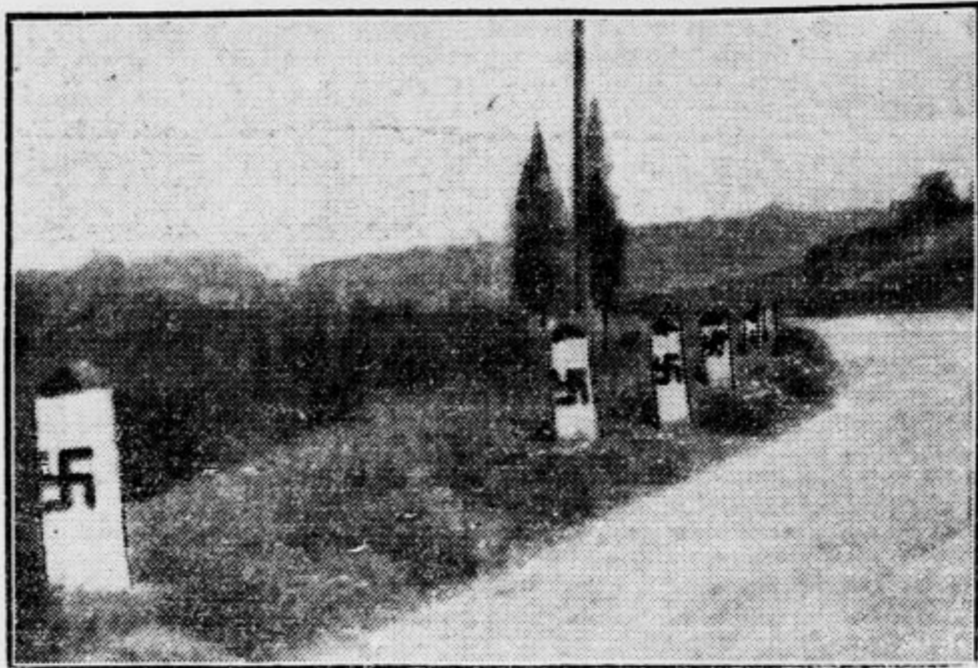
Hitler, ki ima že svoje hiše, kohorte, napadalne oddelke, svoje srajce in letala ter bo v kratkem imel tudi svojo konjenico, hoče, kakor Julij Cezar in Napoleon, imeti tudi svoje ceste, ki bodo nosile seveda njegovo ime. Prvo teh »zgodovinskih cest« se predala prometu te dni med Bernkastelom in Wittlichom. Beli občestni kamni te »Hitlerjeve ceste« imajo seveda s črno barvo naslikano njegovo bojno znamenje: sekirasti križ