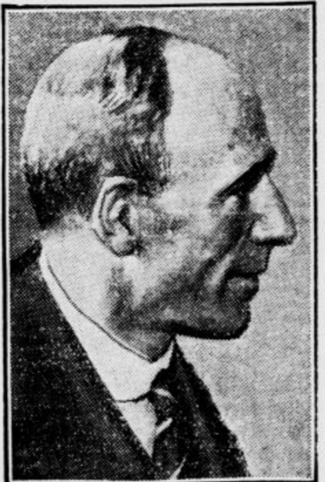
Lord Irwin, ki je imenovan za naslednika pokojnega sira Donalda Mac Leana.