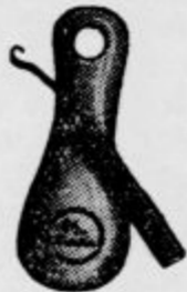
Zlička in ključica Din 4.—