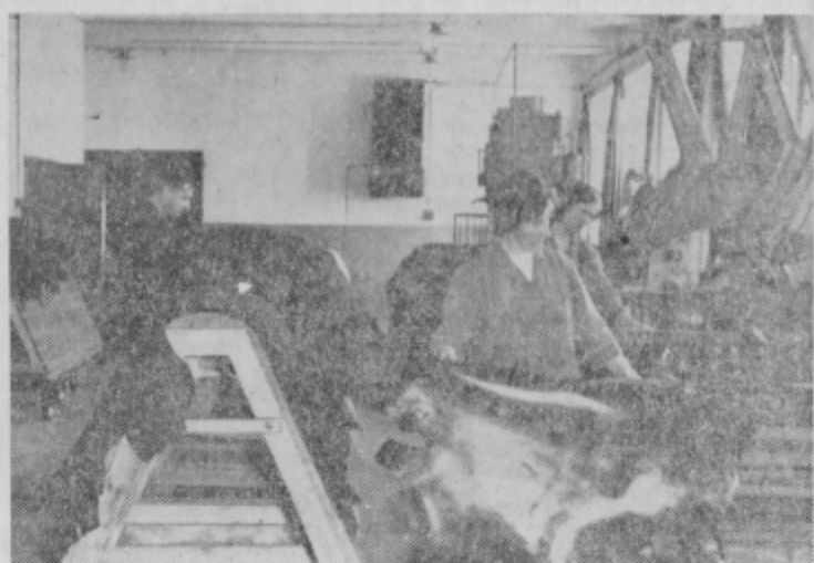
Z Ljutomerskega obrata KONUS

To je nekaj osnovnih ugotovitev »letošnje« reforme, ki je po-