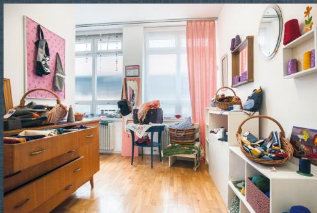
Center ponovne uporabe na Povšetovi ulici v Ljubljani.

Družbeno odgovornost razumemo kot fluiden koncept, odvisen od več dejavnikov. Vsako podjetje ima svojo lastno intelektualno, človeško, finančno in fizično infrastrukturo, poleg tega pa deluje v specifičnem okolju. Po naših izkušnjah 'konfekcijski' pristopi ne delujejo in ni samoumevno, da bi se katera od naših uspešnih pobud izkazala za enako uspešno tudi v katerem drugem podjetju. Velja tudi nasprotno: poskusili smo z nekaterimi aktivnostmi, ki sijajno delujejo v nekaterih drugih podjetjih, pa smo jih opustili, ker se niso obnesle.