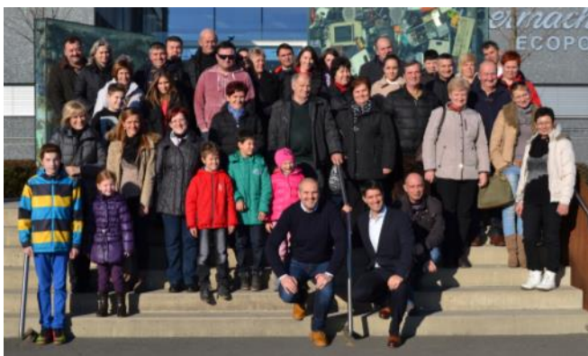
Druženje zaposlenih na predbožičnem izletu

podjetja in v njegovem okolju, je način življenja in dela, ki ga preprosto imaš in se ne moreš odločati ali bo ali ne bo del tvoje strategije. V podjetju so nam pri vsem tem v pomoč različni »pripomočki«, kot je delo v skladu s standardi ISO 9001, ISO 14001, OHSAS 18001, certifikat Družini prijazno podjetje, certifikat Excellent SME Slovenia, samoocenjevanje v skladu z razpisom za Nagrado Horus, v podjetju imenovani ambasadorji medosebnih odnosov, zdravja in varčevanja ter gospodarnega ravnanja ter podobno. Zavedamo se, da moramo biti družbeno odgovorni do zaposlenih, kupcev, dobaviteljev, okolja, mladih, kulture in športa, lokalne skupnosti, državnih institucij, odgovorni do sebe in drugih.