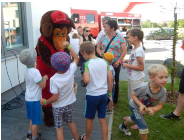
Osveščanje in delo z mladimi

Na to vprašanje je skorajda nemogoče odgovoriti. Ponosni smo na družbeno odgovornost kot celoto v naši organizaciji, na to, da je to način našega vsakodnevnega dela in življenja. Krivični bi bili, če bi izpostavili le eno rešitev, ker se