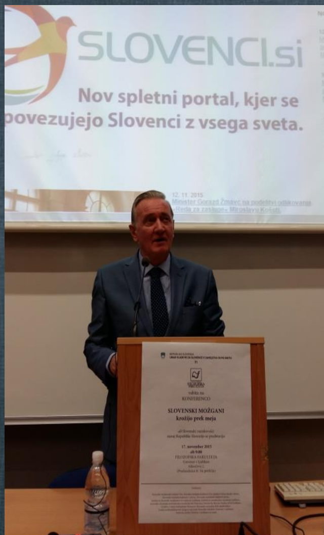
Zgoraj minister za Slovence v zamejstvu in po svetu Gorazd Žmavc, spodaj obiskovalci.

Urad Vlade RS za Slovence v zamejstvu in po svetu je v sodelovanju s Filozofsko fakulteto UL v torek, 17. 11. 2015, pripravil konferenco Slovenski možgani krožijo prek meja – Slovenski raziskovalci zunaj RS se predstavijo .