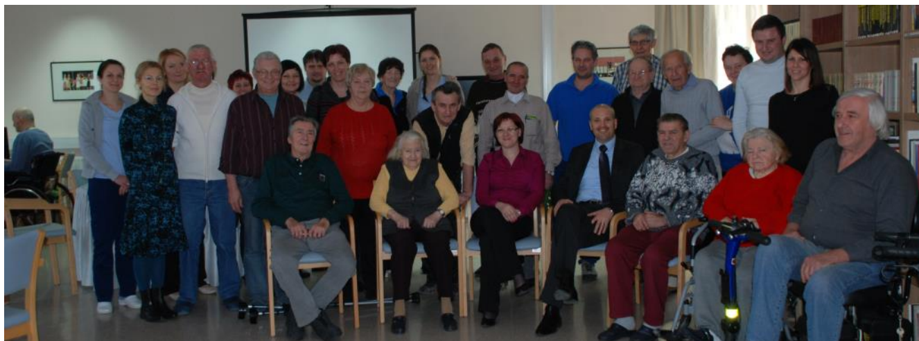
Korporativno prostovoljstvo v Domu starejših občanov DOSOR Radenci

V našem podjetju je DO vpeta že v samo poslanstvo podjetja (Ustvarjamo zdravo okolje za bivanje, za zaposlene, kupce in ostale deležnike) ter v vizijo. Družbena odgovornost je prepoznana kot ena od petih ključnih vrednot, čeprav se že prepleta tudi v ostalih štirih (usmerjenost k strankam, skrb za zaposlene, poslovna odličnost in gospodarnost). Skrbnika strateškega cilja družbene odgovornosti smo določili, da skrb za DO v našem podjetju ne bi bila prepuščena sama sebi in bi imeli osebo, ki DO aktivnosti spremlja, vodi pregleden arhiv posameznih aktivnosti in bdi nad izvajanjem le-te ter spremljanjem realizacije ter odklikov realiziranega od planiranega in o DO aktivnostih poroča tudi v posebni točki v letnem vodstvenem pregledu. Skrbnik je tisti, ki vodi neformalno oblikovan tim za družbeno odgovornost, skliče posamezne delovne sestanke, kjer se ožji člani tima pogovarjamo o posameznih aktivnostih na področju DO, o načrtih za prihodnje in o možnih izboljšavah. Hkrati je skrbnik član tima za certifikat Družini prijazno podjetje in je vabljen tudi na seje Odbora za varnost in zdravje pri delu. Je torej tisti, ki povezuje vse niti družbene odgovornosti in skrbi za to, da aktivno spremljamo in analiziramo ukrepe na področju DO.