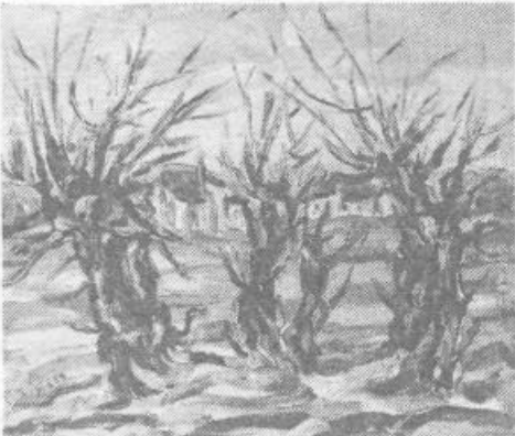
Na sliki: Vrbe, olje 75 x 65 cm, nastale 1973. leta

Književnik Rudi Miškot je ob tej razstavi zapisal: »Slikarjev mundus (svet) posega od tihožitij tudi v bivanje malih, očem skritih, komaj zapaženih bitij – žuželk, skarabejev v povečani anatomiji njih značilnosti. V krajine letnih časov, sončnih vzhodov in zahodov, mesecev od pomladi, poletja do jeseni in zime. Nočne motive, ro-