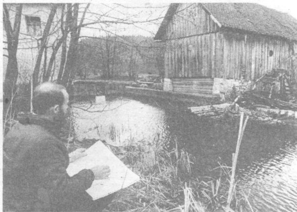
Na tako imenovanem Ex tempore v Velikih Laščah, ki je bil 8. in 9. aprila so akademski slikarji »pričarali« na platno Trubarjevo zapuščino – mlin v pomladanski prelestnosti barv