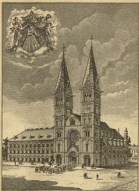
Nova frančiškanska cerkev Sv. Marije, Matere Milosti v Mariboru na Štajarskem.