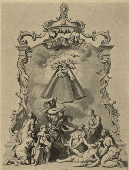
Čudodelna podoba Matere Milosti v frančiškanski cerkvi v Mariboru na Štajerskem.