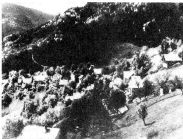
Predvojne Dražgoše, na Pečeh

Zdaj so Dražgoše postale nekakšna partizanska vojašnica. Bilo je prvič, da se je v neki vasi dalj časa zadrževala tako velika uporniška enota. In še sredi hude zime! Sicer pa prav zato! Že prvi dan po prihodu je poveljstvo bataljona s komandirji čet pregledalo vas in teren okoli nje, ter za primer napada pripravilo obrambni načrt. Določilo je položaj za vsako četo, vsak vod in predvidelo tudi mitraljeska gnezda. Za primer napada je poslej vsak borec vedel, kam naj gre ali kje naj zasede položaj. Bataljon je bil oborožen tako, da je skoraj