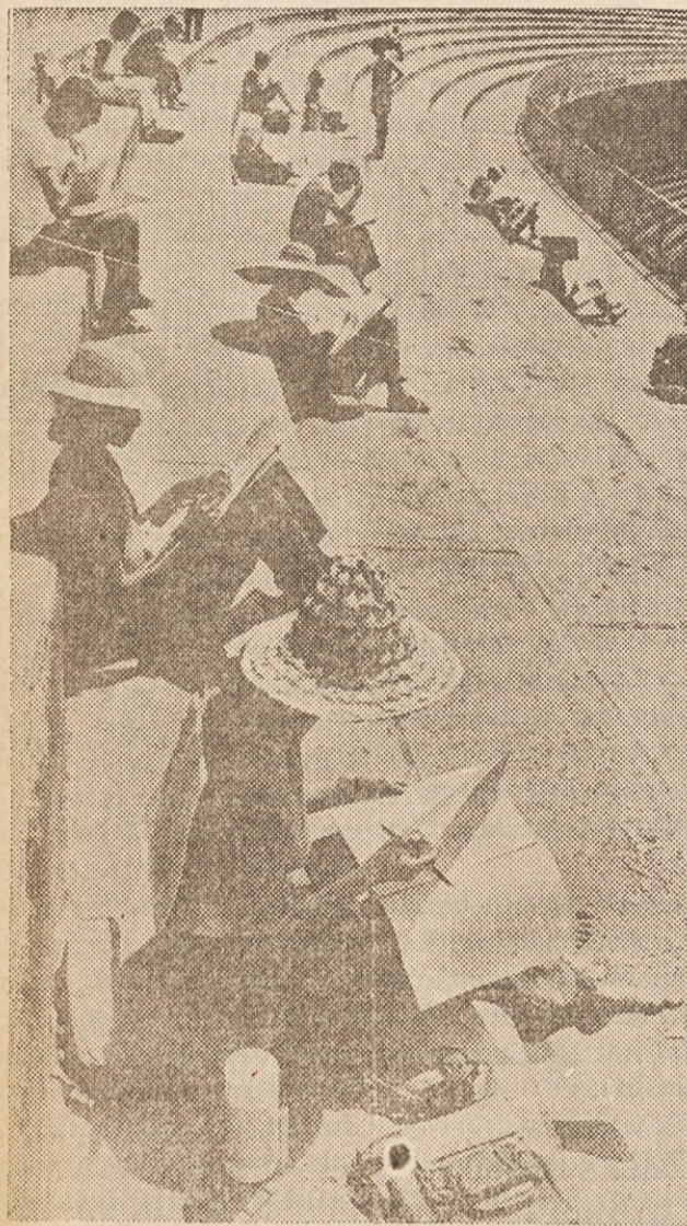
SPREJEMNI IZPITI — Na sliki vidimo mlade fante in dekleta, ki opravljajo v Marcana stadionu v Rio de Janeiro sprejemne izpite za na visoke šole. Na razpolago je 18,779 mest, prijavitelcev pa kar 52.000.