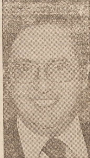
James T. Lynn