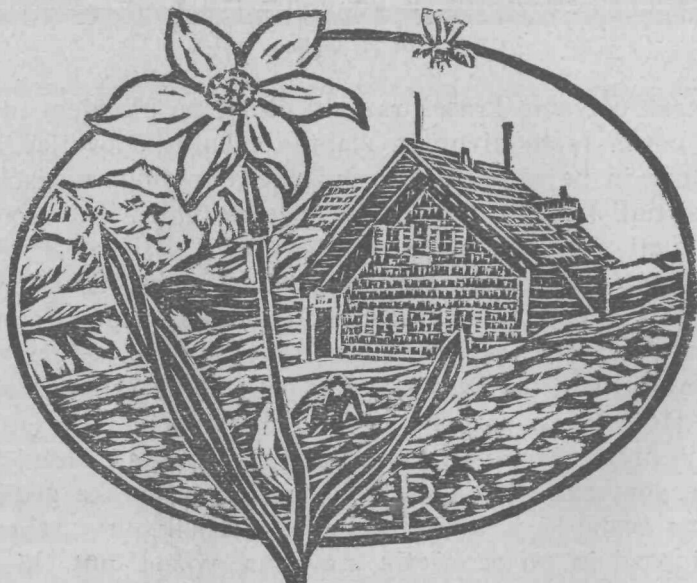
Narcis in vrhnja koča na Golici

Srce me boli, ker tu že mejí država na nas, ki stotine let ogroža naš svet, a zadnji je čas še ves Korotan ugrabila nam in bratov sto tisoč umira nam tam!