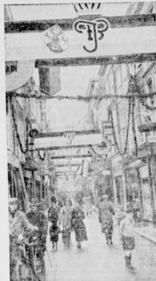
Nizozemska se pripravlja na poroko svoje prestolonaslednice.

Madrid, 20. dec. AA. (Havas) Madridsko vojno ministrstvo je snoči ob 21 izdalo uradni komunikacije, v katerem pravi med drugim: Na guadarramski fronti se je razvil topniški dvoboj.