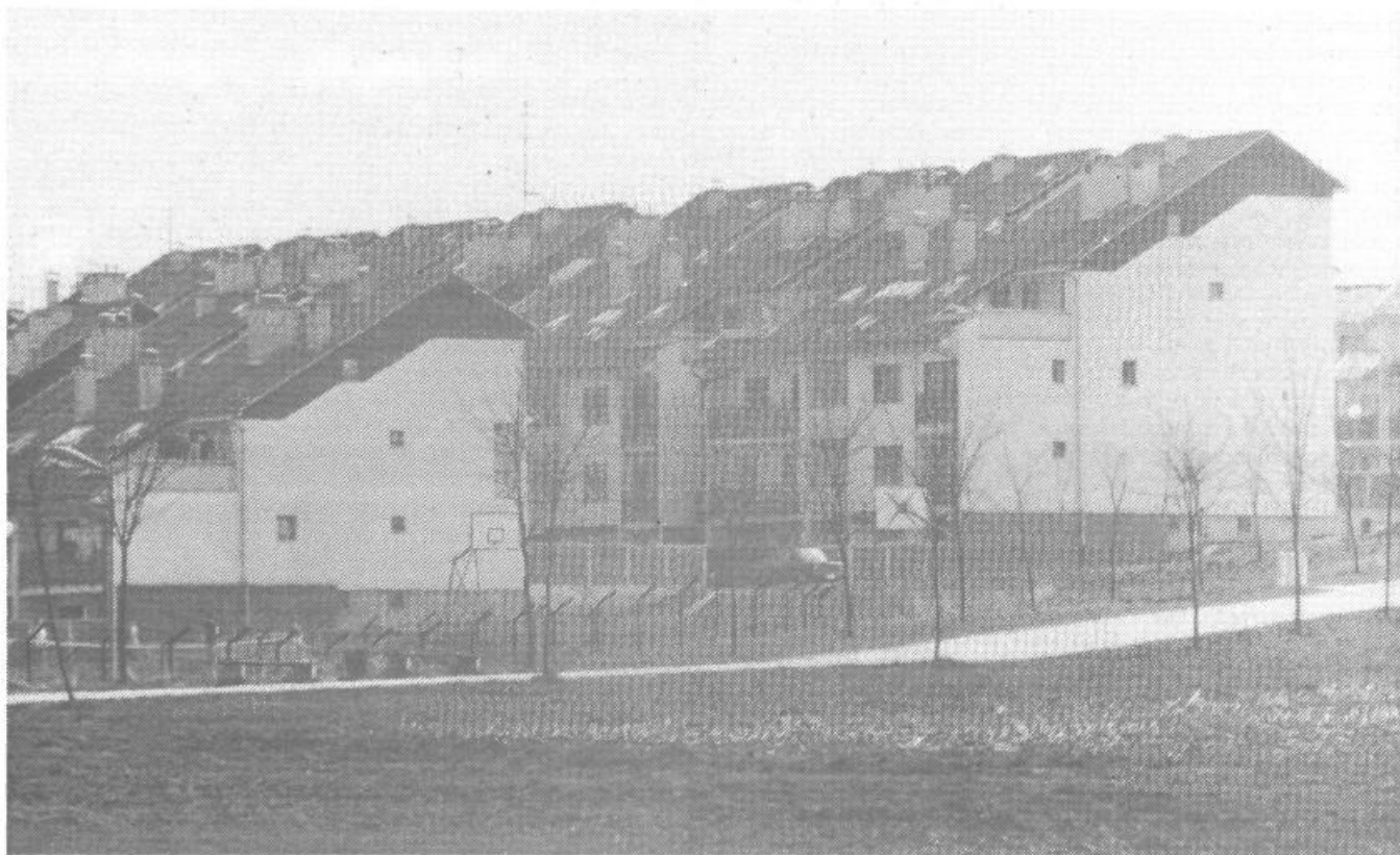
Na območju Viča pa je zrasla ena najlepših stanovanjskih sosesk Grba.