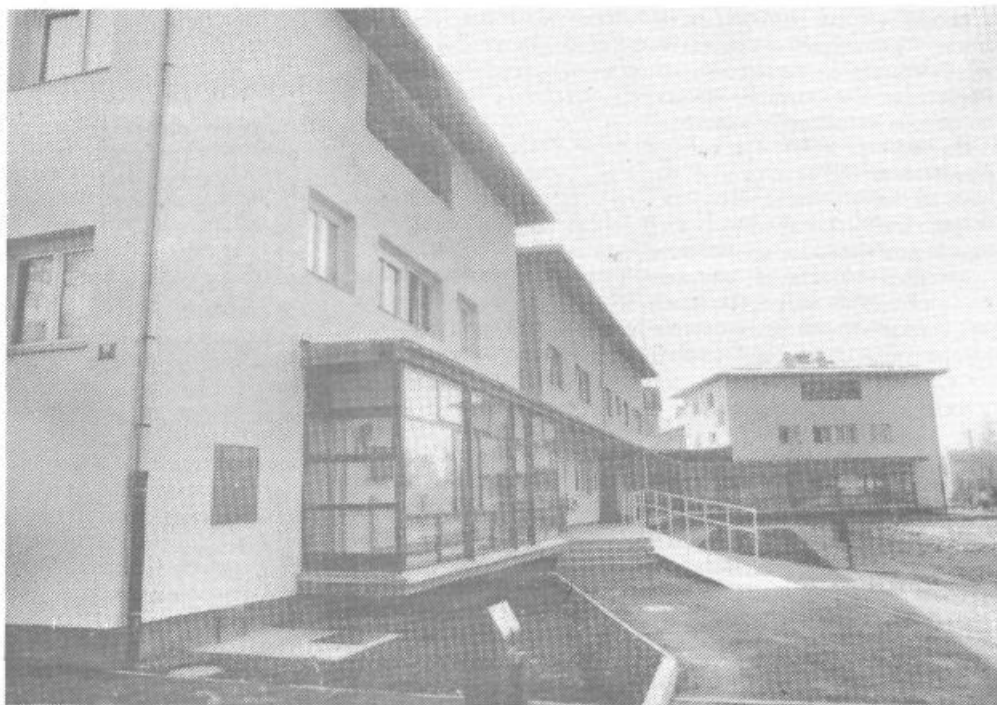
7. Med objekti, ki so bili zgrajeni v okviru programov družbenih dejavnosti, velja izpostaviti nov Dom Malči Belič, zgrajen iz sredstev republiškega programa.

Da bi zadostili povečanim potrebam po osnovnošolskem prostoru smo pripravili projekte za novogradnje podružničnih šol Rob, Turjak, Barje ter naročili dokumentacijo za samostojno šolo v KS Rakova jelša. Za posodobitev in ureditev v skladu s sanitarnimi standardi smo naročili izdelavo projektne dokumentacije za drugo fazo prizidave v OŠ Velike Lašče ter dograditev OŠ Ig. Pripravlja se idejni projekt za povečanje kapacitete OŠ Vrhovci, OŠ Brezovica. Kot nujno investicijo bi morali letos izvesti še dokončanje gradnje v OŠ Velike Lašče (IV. faza s kuhinjo).