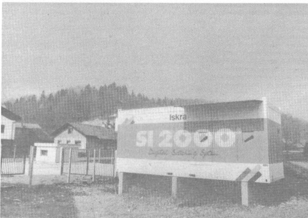
Tudi na področju telefonije se je marsikaj premaknilo na bolje. Tole pa je nova telefonska centrala v Notranjih Goricah.

PTT: v preteklem obdobju je bilo postavljenih večje število telefonskih central in sicer: ATC Škofljica z 992 priključki, ATC