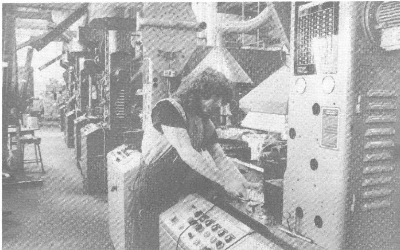
Gospodarstvo v občini beleži nekaj novih pridobitev. Ena pomembnejših je vsekakor Plutalov objekt za razvoj nove embalaže.

Omeniti velja tudi načrtovano izgradnjo cone drobnega gospodarstva na Brdu, podjetniškega inkubatorja za računalništvo na dosednji lokaciji KIP–a na Opekarski, poslovno–trgovski objekt Murgle, poslovni center Grba pri Utensiliji (s prostori za storitvene dejavnosti v pritličju in pisarnami v I. nadstropju). V pripravi je izgradnja poslovnega centra (trgovina, gasilski dom, postaja milice, delavnic drobnega gospodarstva) na Rudniku na nekdanji lokaciji obračališča mestnega avtobusa območje urejanja VM 1/3.