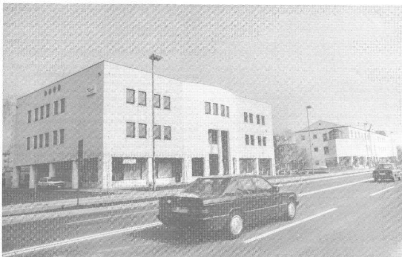
Dva moderna centra drobnega gospodarstva ob Tržaški cesti sta dokaz, da je na tem področju moč marsikaj hitro in uspešno uresničiti.

Gre za zadnje faze priprave dovoljenj za poseg v prostor s pretežno znanimi investitorji oz. izvajalci gradnje za trg.