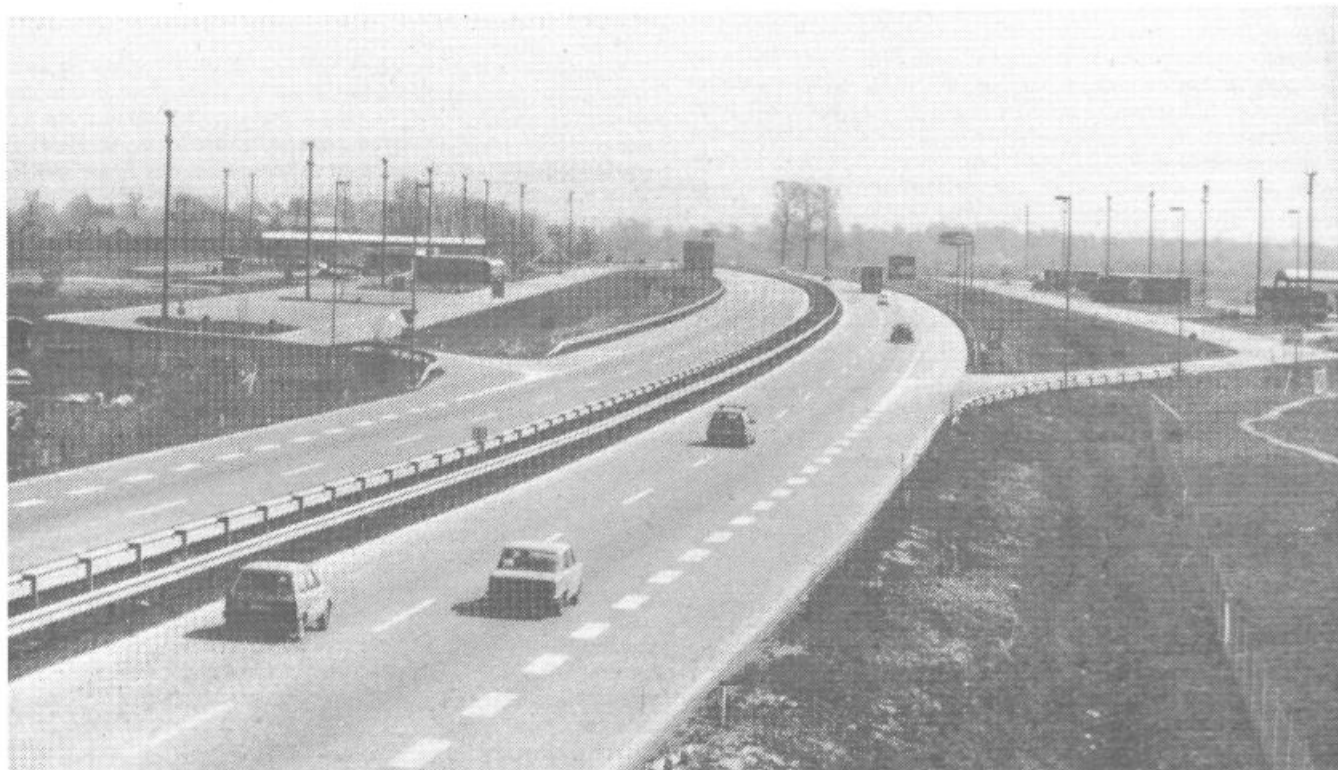
S tem ko je oživila južna obvoznica, je bil močno razbremenjen promet v mestnem predelu, pa tudi sicer hitra cesta s svojimi objekti pomeni tudi hitrejši in varnejši promet.

Precejšen prispevek k čistejšemu zraku je prispevala tudi izgradnja južne obvozne avtoceste, saj se je močno zmanjšal tranzitni promet skozi mesto. Predvideni ureditveni načrt za območje Slovenija avto zahteva tudi selitev Livarne barvnih kovin s tega območja. KIP pa se že seli z Opekarske ceste. Bilo je opravljenih tudi precej drobnih akcij, ki vsaka zase ne pomeni veliko, v globalu pa predstavljajo kar precejšnje ukrepe za izboljšanje bivalnega okolja (namestitvev kontejnerjev za zbiranje odpadnega stekla, selitev obrtne zadrage. Prevoz z območja Tržaške ceste in s tem zmanjšanje vožnje in parkiranja tovornjakov na tem območju, izboljšanje prometne infrastrukture in s tem hitrejši in varnejši odvijanje prometa – Tržaška c., križišče Orlove c., itd.).