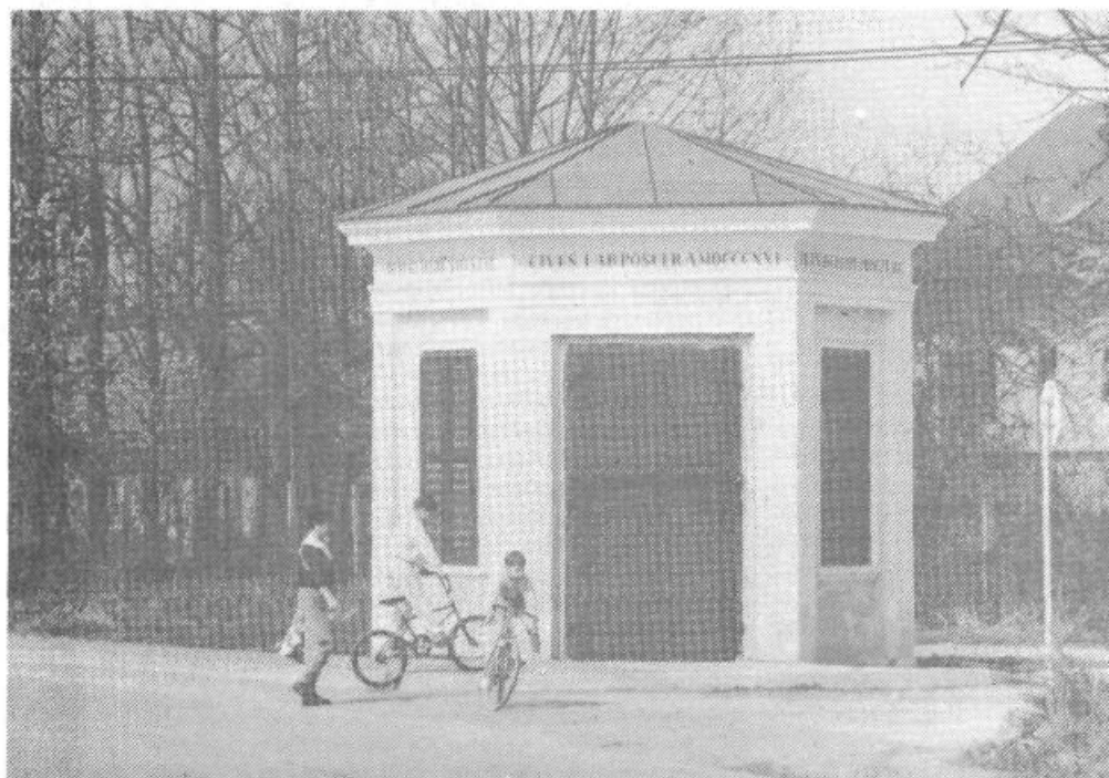
Skrb za ohranjanje kulturne dediščine je trajna in celovita. To ponazarja tudi prenovljen paviljon ob Cesti dveh cesarjev.

bila precejšnja sredstva vložena v investicijska, sanacijska in obnovitvena dela na objektih ZŠD Svoboda, ZŠD Krim, ŠD Krim, TVD Partizan Trnovo, TVD Partizan Vič, ŠD Škofljica, ŠD Mokerc Ig, ŠD Jama, Kopališče Kolezija, KKK Ljubljana, RC Ljubljana.