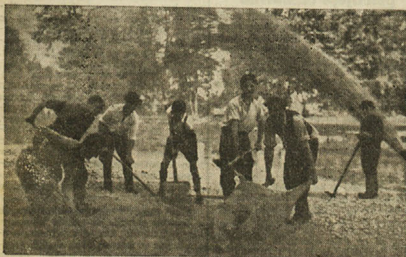
Prostovoljni delavci pri gradnji novega stadiona