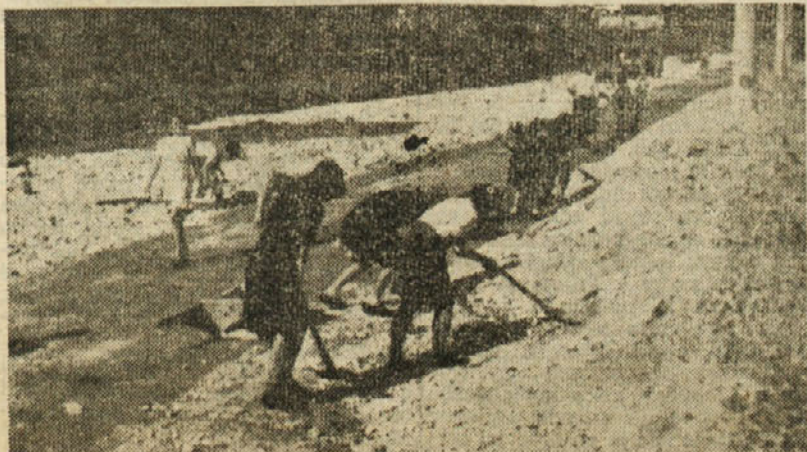
Prostovoljno delo na cesti v Trbovljah