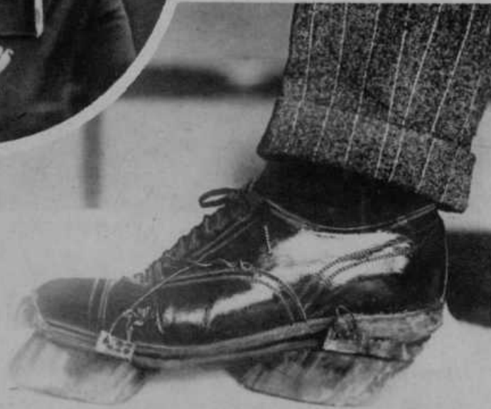
Ameriški lihotapci alkohola

kakor ga ima „Italia“, s katero je letel italijanski general Nobile na severni tečaj. Zrakoplov je napolnjen s plinom (vodikom), ki je neprimerno lažji kot zrak. Radi ogromne velikosti in negibčnosti se zdi, da zrakoplovi nimajo bodočnosti.