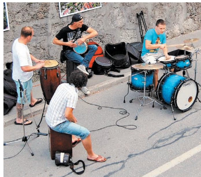
V ponedeljek je na festivalu zavel veter kamniške mladine. V Samčevem predoru so bili v Bobnarski masovki glasni izvrstni kamniški bobnarji, na Glavnem odru pa sta se predstavili kamniški skupini AntiOksidanti in Hulahoop.

ponovno spoznala, da Kamfest cilja v pravo smer in, da je to ta smer, ki si jo želimo. Želimo živeti v urbanem mestu, kjer se imamo lahko takole »fajn«. Kjer lahko posedamo po travi, ne da bi nas ljudje čudno gledali. Jemo palačinke, ki niso drage. Kjer imamo knjižnico, da lahko beremo. Kjer se lahko po lastni reki vozimo s kanujem. Skratka imejte radi Kamnik in vse, kar se tukaj dogaja. Drugo leto bo pač drugo leto, mi bomo tukaj. Hvala vsem sponzorjem in obrtnikom. Hvala vsem, ki ste tukaj. Hvala sosedom Keršmančevega parka, ki ste imeli dovolj potrpljenja, da ste nas prenašali tukaj. Hvala vsem stanovalcem v starem mestnem jedru, ki se zavedajo, da če živim v starem mestnem jedru, moram potrpeti tudi kakšno prireditev, pa ti zato ni nič hudega. To je bil Kamfest 2012.«