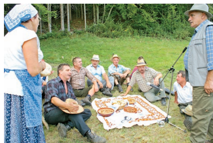
Po košnji pride na vrsto malica - zelje, špehovka, klobasa...