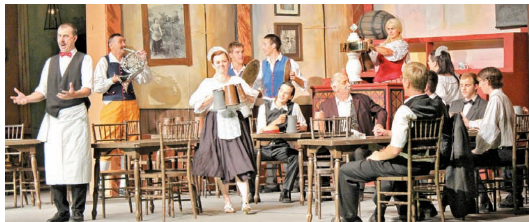
Švejk Jaroslava Haška je po vsem svetu postal pojem nenasilnega odpora proti brezčutnim avtoritetam, posameznikom in institucijam, predvsem pa proti nesmiselnim vojnem, ki jih te vedno znova povzročijo. Ravno zaradi te vedno aktualne tematike je letošnja predstava bila še toliko bolj priljubljena med obiskovalci.