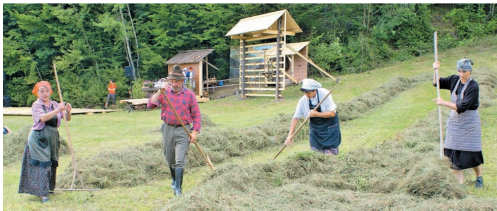
Seno je treba zgrabiti in naložiti na voz.