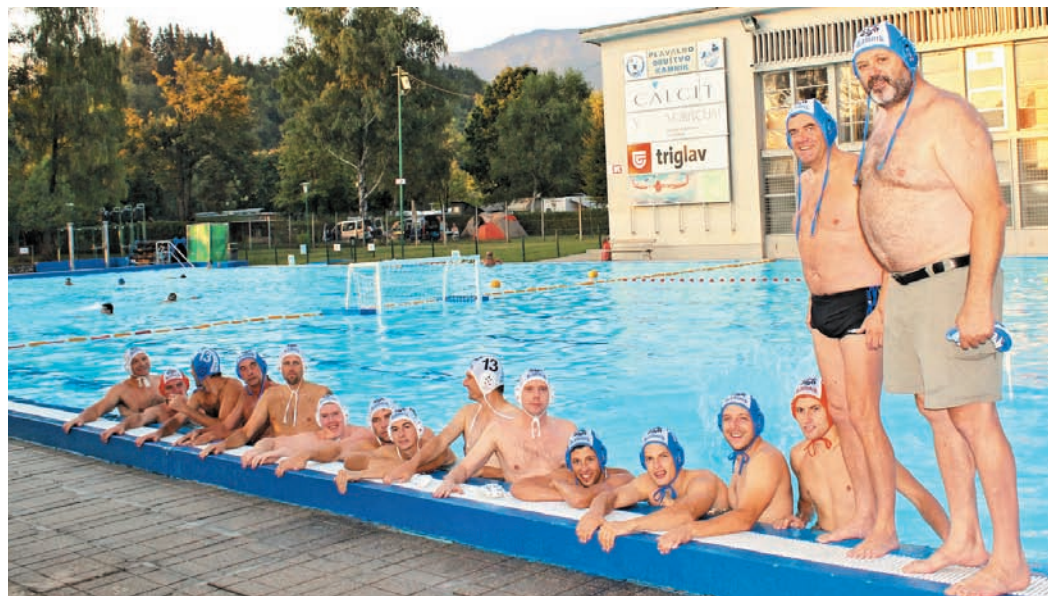
Igralci obeh ekip pred tekmo.