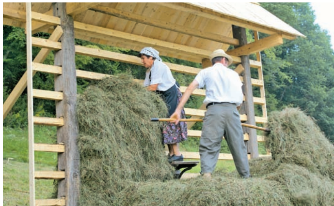
Balohova Fani iz Zgornjega Tuhinja je vse možakarje »v koš dala«, ko je pokazala, kako se seno v kozolec spravlja. ANDREJ ŽALAR

Reportaža s tridnevnega dogajanja v Snoviku na strani 4.