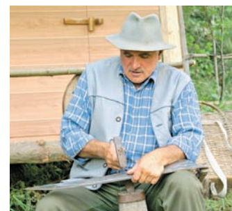
Gospodar še pred zoro skleplje koso.