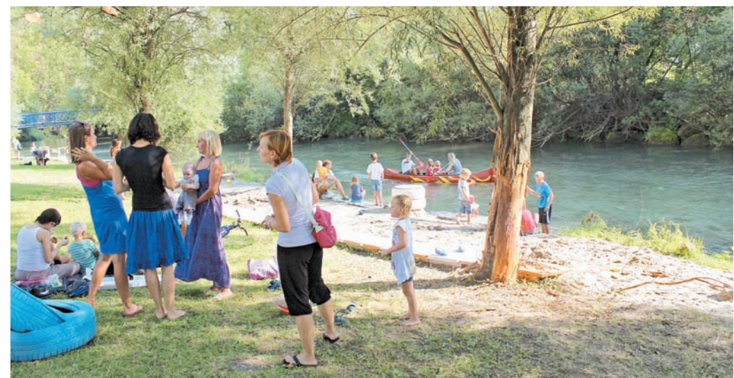
Skupina Štajn je v Keršmančevem parku z urbano opremo ustvarila Mesto ob vodi. Obrežje Kamniške Bistrice so spremenili v Plažo, kjer so lahko obiskovalci uživali na pomolu, se sončili na peščeni plaži, otroci so se igrali v peskovniku, viseče mreže pod drevesi so vabile k lenarjenju, odslužene gume pa k počivanju. Vožnja s kanujem skozi dan in zvečer pa je bila pri obisku plaže seveda obvezna.

po zaključku festivala. Kaj bo v parku zares ostalo, tudi sam ne ve, saj to ni odvisno od Štajnovcev.