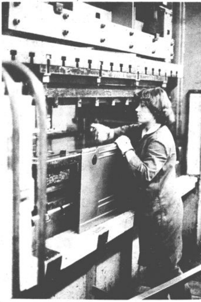
V torek so v počastitev dneva žena odprli v Gorenju razstavo fotografij na temo »Delavka v združenem delu«

Predstavniki Zveze vojaških starešin bodo v času priprav na kurirčkovo torbico pomagali pionirjem tudi pri ustanavljanju obrambnih krožkov.