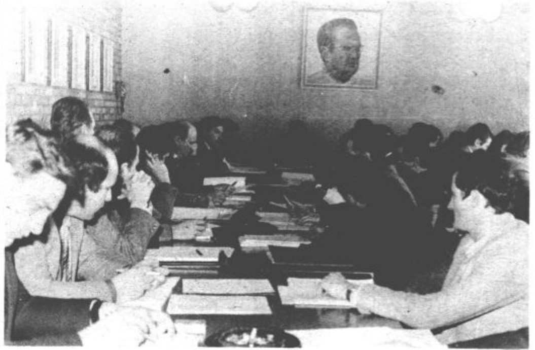
Kadrovska in organizacijska okrepitev obeta dobro delovanje