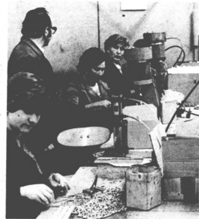
V letošnjem letu bodo izvoz še povečali

Ob koncu pogovora smo urednici Informatorja zastavili še vprašanje, kakšen naj bo odgovor in glavni urednik glasila v delovni organizaciji. Nanj je odgovorila takole: „Gotovo mora imeti vsaj malo novinarske žilice, predvsem pa veselje do takega dela. Spodobno mora biti kakšno zelo pomembno stvar dobro napisati, da delavci z zanimanjem berejo. Znati mora opazovati in biti v središču dogajanja v delovni organizaciji. In to pri nas je. Seznanjena sem z vsemi pomembnimi dogodki, prav tako o uspehih ali težavah.“