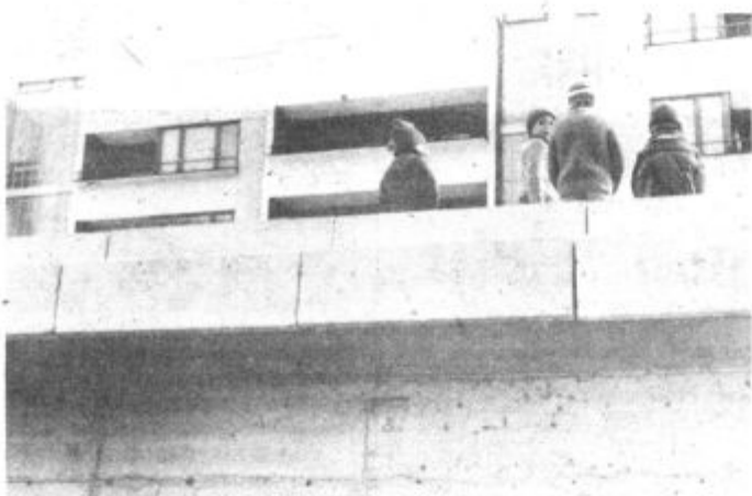
Le kdo bo kriv, če bo kakšen otrok zdrsnil na parkirišče?

Parkirni prostori niso urejeni in stanovalci morajo puščati avtomobile kar na cesti