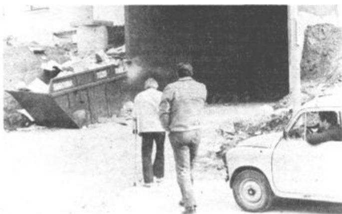
Dostop do stanovanjskega bloka še sploh ni asfaltiran in v zadnjih dneh je bil blaten

Nepravilnosti je prav gotovo toliko, da bi jih res morali odpraviti prej, predno so stanovalcem razdelili ključe.