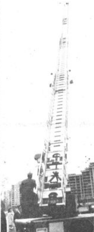
Takšna lestev je nujno potrebna v mestih.