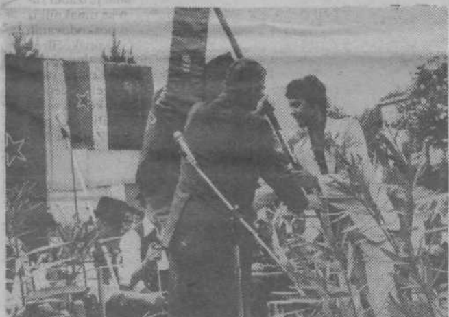
Na proslavi so slovesno razvili prapor ZRVS