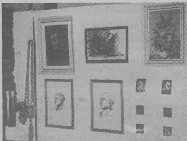
Uspela razstava izdelkov umetnikov amaterjev v osnovni šoli