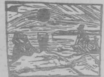
Erich Heckel: Rajstvo sonca. 1914

Do 20. oktobra si lahko v razstavnih prostorih Cankarjevega doma ogledamo razstavo grafik nemških ekspresionistov Maxa BECKMANA, Otta DIXA, Lyonela FEININGERJA, Ericha HECKLA, Otta MUELLERJA, Emila NOLDEJA Maxa PECHSTNERJA in Karla SCHMIDTA.