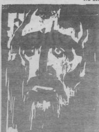
Emil Nolde: Pevci. 1912