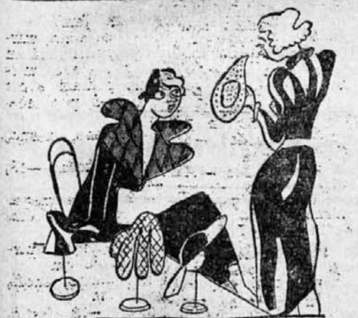
Ne, ne, ta klobuk ne morem nositi. Preveč je videti, kakor klobuk...