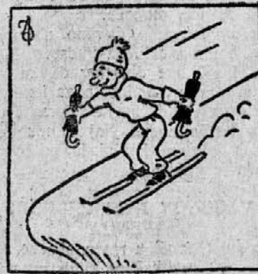
Stoj! Prepadi! Navzdol, počez, smuk na planinski ples!

m Na konskripcijski urad mestnega poglavarstva je vedno večji naval glede zamenjave poslovnih knjižic. Policijska je doslej izdala nad 1000 novih knjižic, konskripcijski urad pa okoli 600. Zamenjati pa je treba v Mariboru še 1000 knjižic.