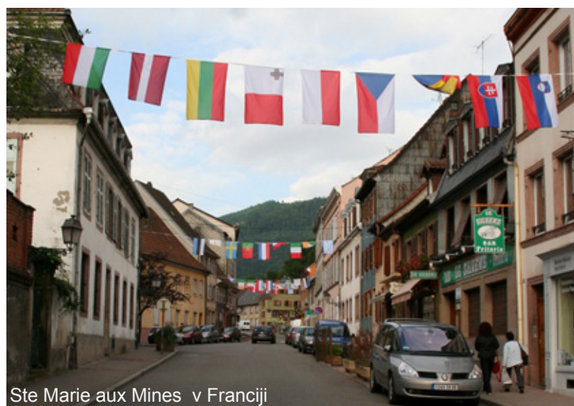
Ste Marie aux Mines v Franciji

Razstava: »Trésor minéral de Sloveie (Mineralni zakladi Slovenije)« na 47. mednarodni razstavi mineralov v Ste Marie aux Mines v Franciji