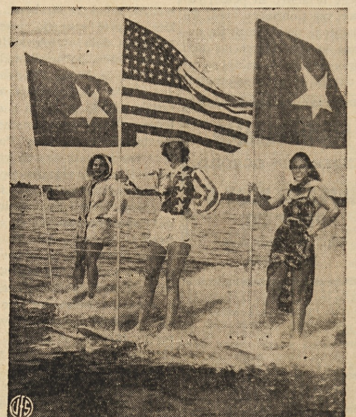
ZVEZDE — Tri lepote drse po vodi v Cypress Gardens, Fla., v počastitev dveh novih zvezd na ameriški zastavi. Ona na levi predstavlja Alasko, ona na desni pa Havaje.