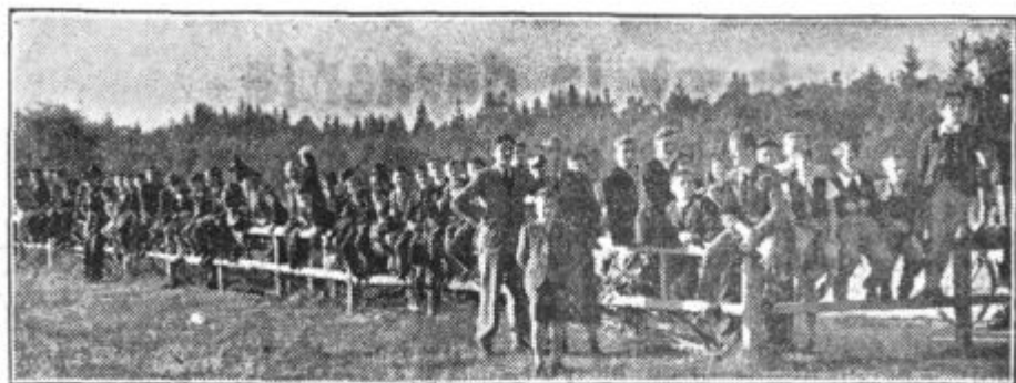
Mnogo mladih ljudi opazuje letenje srečnih nagrajencev