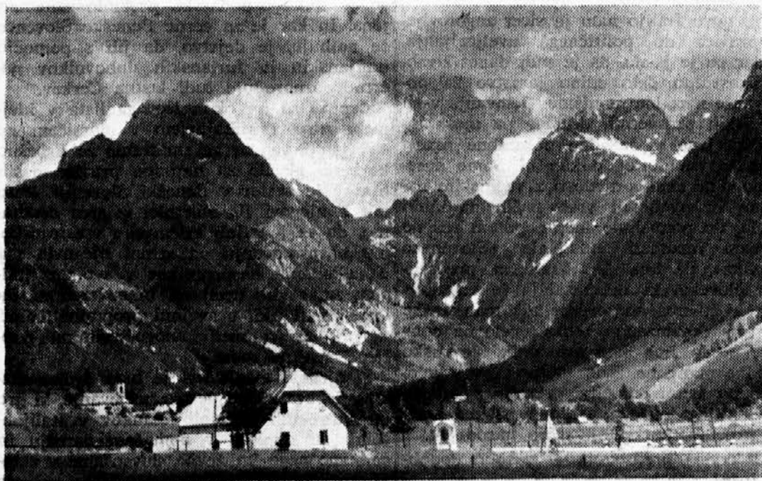
LOG POD MANGRTOM