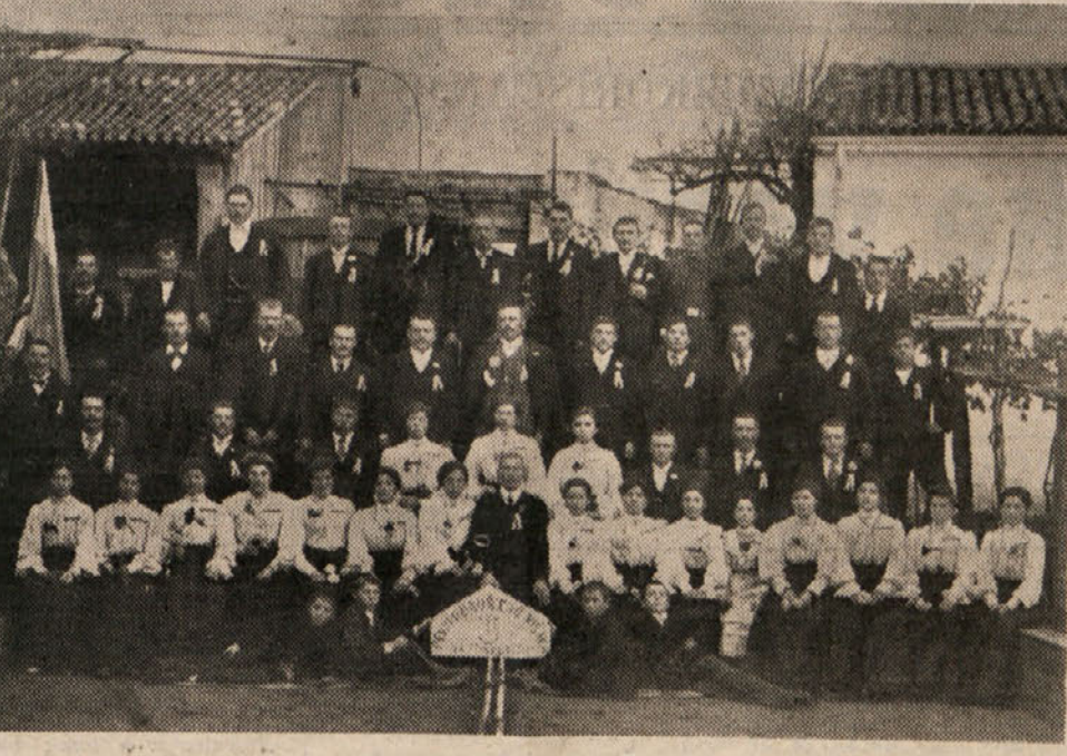
Clani konkonelskega prosvetnega društva «Višava», ki je bilo ustanovljeno 28. oktobra 1905. Silka je bila posneta leto dni pozneje.