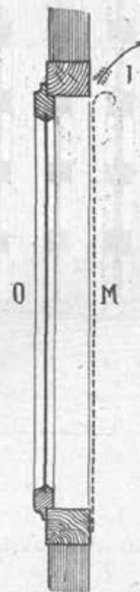
Amerikanska begalnica na okna.

naj bodo založene z deskami ali kako drugače popolnoma zaprte. Okna pa pri-