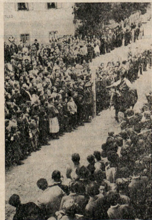
Pogled na del množice med ziljskim štehanjem ob gostovanju gradišćanskih Hrvatov v Šmihelu nad Pliberkom

Svidenje z gradišćanskimi Hrvatimi in Hrvati je bilo prisrčno in iskreno. Pri vsej prireditvi je izžarevala pristna do-