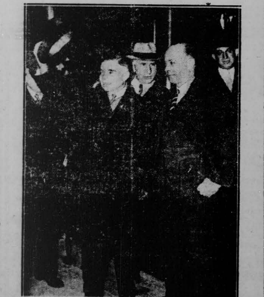
fotografiran v spremstvu ameriškega poslanika za Sovjetsko Unijo Bullitta (na desni).