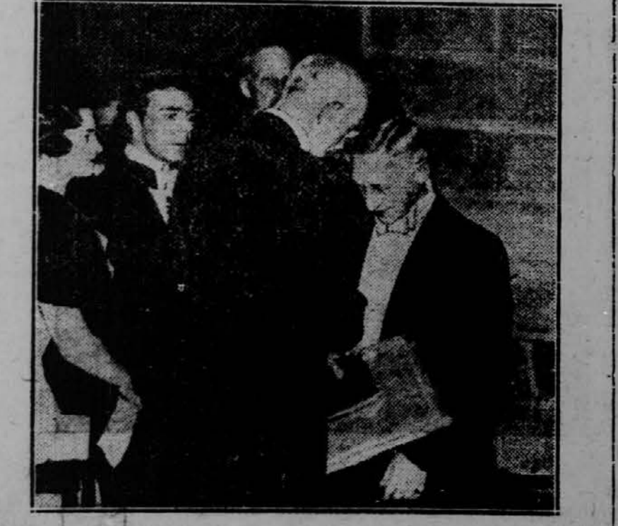
Po veliki cerimoniji v Stockholmu je švedski kralj podelil Noblovo nagrado za leposlovje rusckemu pisatelju Ivanu Buninu.