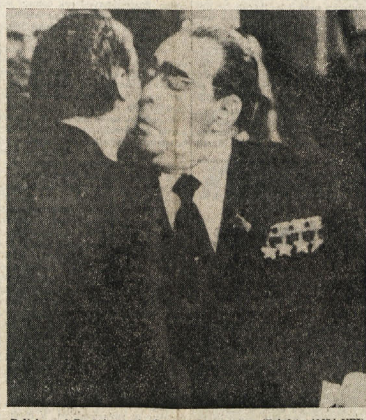
Poljub med Brežnjevom in Carterjem