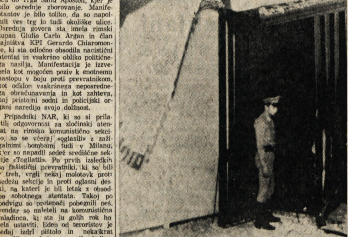
Bomba eksplozija je v noči od nedelje na ponedeljek razdejala stranski vhod genovske sodne palače in lažje ranila tri agente varne javnosti. Odgovornost za podli izpad in je prevzela skupina «Volante rosso», ki se prvič pojavlja na odru terorizma. Na sliki vhod sodne palače