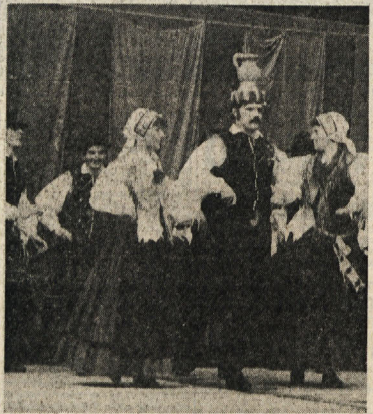
Na prazniku «Delas in «Unitas» v Padričah je v nedeljo popoldne poleg moškega in ženskega zbora PD «Tabora» z Opčin nastopila v kulturnem programu tudi folklorna skupina iz Celja, ki je med številnimi občinstvom zela veliko uspeha