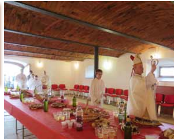
Blagoslov Martinove dvorane