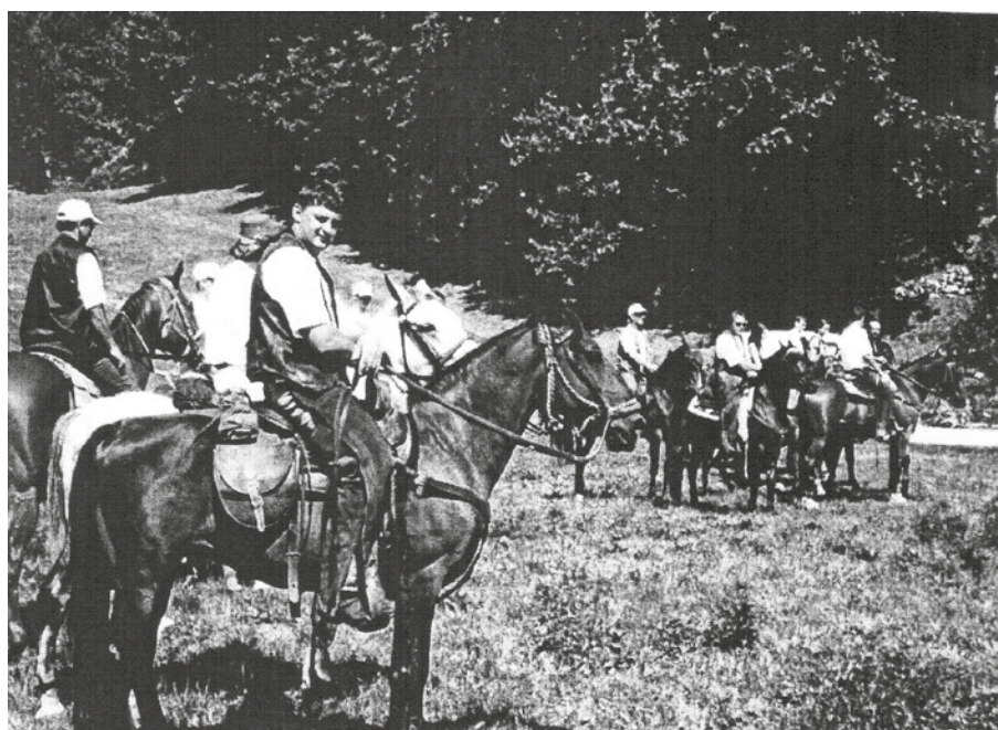
S konji na Šmohor

Zadnje štetje prebivalstva v letu 1991 beleži stagnacijo v kraju, kar zadeva rodnot. Kraj