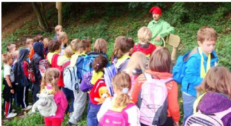
Škrat Štorček nam je povedal svojo zgodbo.