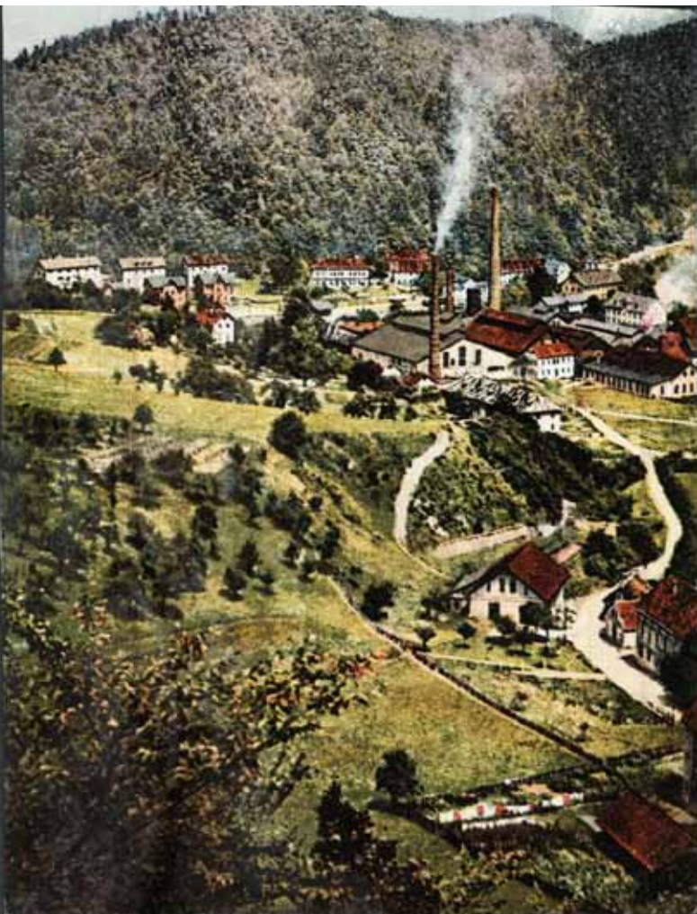
Prva fotografija Štor iz leta 1903

Že v letu 1850 so bile v Avstriji ustanovljene prve politične občine na osnovi zakona iz leta 1849. Na območju sedanje občine Štore so bile leta 1850 formirane naslednje krajevne (politične) občine: