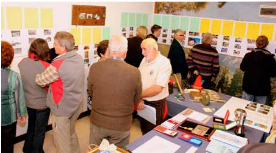
Ob odprtju si je razstavo ogledalo približno 60 planincev.

Planinsko društvo (PD) Železar Štore bo 10. novembra praznovalo 40 let obstoja. Okroglo obletnico so planinci minulo soboto obeležili v društvenih prostorih na Lipi v Štorah. Pripravili so pregledno razstavo, kjer so v besedi in sliki na zanimiv način predstavili delovanje društva od ustanovitve pa do današnjih dni. V sejni sobi je na ogled tudi oprema planinca, kjer lahko ljudje vidijo originalne primerke planinske opreme še iz časov ustanovitve društva. Odprtje je popestrila Vokalna skupina Lipa, katere člani so zapeli nekaj slovenskih pesmi, druženje pa so domači planinci in povabljeni gostje zaključili ob hrani in pijači.