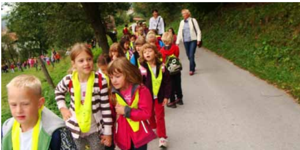
Na začetku naše poti