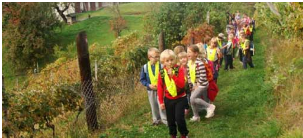
Na izletu smo se imeli lepo.