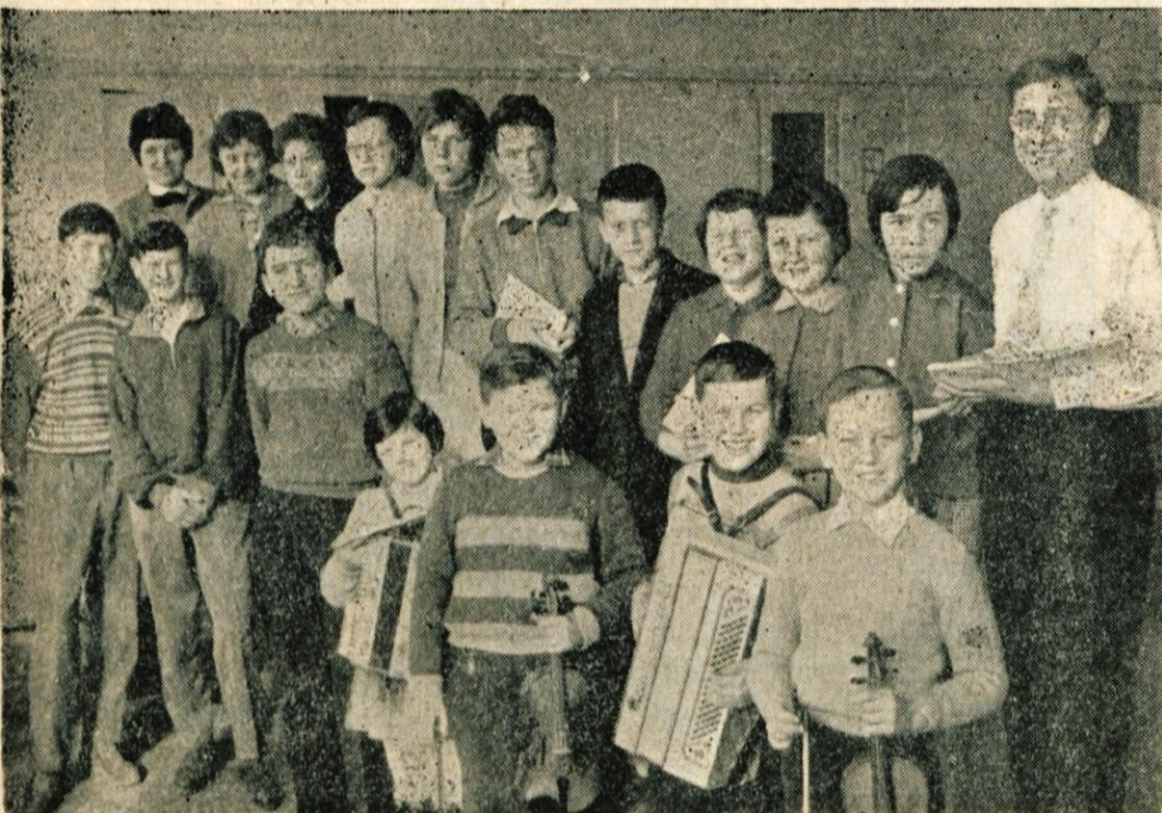
Na osnovni šoli »Simon Jenko« v Kranju so učenci ob obletnici Prešernove smrti pripravili oddajo pod naslovom »Spoznavaj svet in domovino«. Naš posnetek prikazuje nastopajoče, ki so se po končani prireditvi še enkrat predstavili pionirjem-poslušalcem